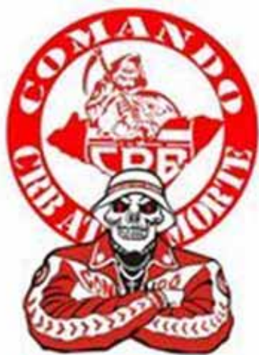
Símbolo da Comando Alvi Rubro

Reconhecemos a força e a eficácia da linguagem expressa na formação discursiva do grupo como algo fundamental. É importante realçar que a comunicação do grupo acontece no campo verbal, virtual e em gestos e expressões visuais que produzem múltiplos sentidos ao grupo. Por exemplo, a caveira e a foice, que compõem os símbolos na bandeira da torcida Alvi Rubra, denotam sentidos macabros; são significantes de morte que mostram um aspecto sombrio no imaginário social. Não podemos desconsiderar que todo discurso remete à memória dos significantes (caveira, foice), que contribui para o entendimento do membro da TOF, no caso específico.