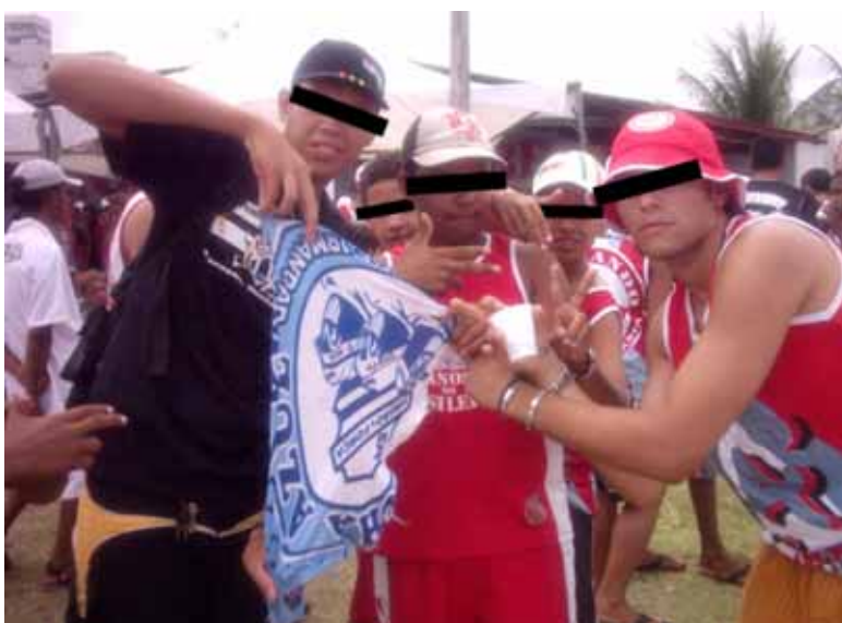
A imagem acima foi captada no aniversário de 14 anos da TOCV, dia 15 de setembro de 2007. É a socialização da captura do símbolo da TOF rival, Mancha Azul, sua representação maior.

Assim como os grafites, a camisa também se constitui num símbolo bastante representativo das TOFs, chegando a possuir um grande valor na dinâmica das organizadas. Da mesma forma que a camisa da Organizada é considerada um dos objetos mais sagrados para o grupo, senão o mais importante, “tomar” a camisa do adversário torna-se uma das maiores expressões de potencialidade e coragem para a maioria das TOFs. Conquistar os símbolos do “inimigo”, possuí-los e destruí-los são rituais que ajudam a reforçar o que se compreende como superioridade grupal.