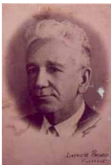
Museu dos esportes – Fundador Lafaiete Pacheco

Em 1917, na gestão de Pedro Lima, começaram as obras de construção do Estádio propriamente dito - as arquibancadas de madeira. Haroldo Zagalo, pai de Mário Jorge Lobo "Zagalo", ex-jogador e técnico da seleção brasileira, transmitiu seus conhecimentos para os jogadores, assim como um alemão chamado Peter juntou-se à turma, fazendo avançar o futebol na Pajuçara. Até o ano de 2008 era o único representante alagoano no cenário futebolístico nacional, disputando o Campeonato Brasileiro Série B. Atualmente o CRB disputa a série C do Campeonato.