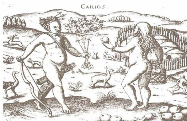
Índios Guarani ou Carijó, gravura de Ulrich Schmidel (1510-1579).

Os indígenas acreditavam que, quando o mundo surgiu, haviam recebido do Deus criador de tudo o Amambaé, a “Terra do Homem”. O Amambaé era o lugar para plantar e garantir o sustento de cada família. Todos os indígenas tinham direito a uma parte; havia para todos. Sua sobrevivência estava integrada à natureza: os homens faziam as armas, protegiam o grupo, caçavam, pescavam e preparavam a terra para as plantações; as mulheres plantavam, colhiam, cozinhavam e moldavam objetos de cerâmica usados nos rituais e nas refeições; as crianças brincavam e aprendiam a viver.