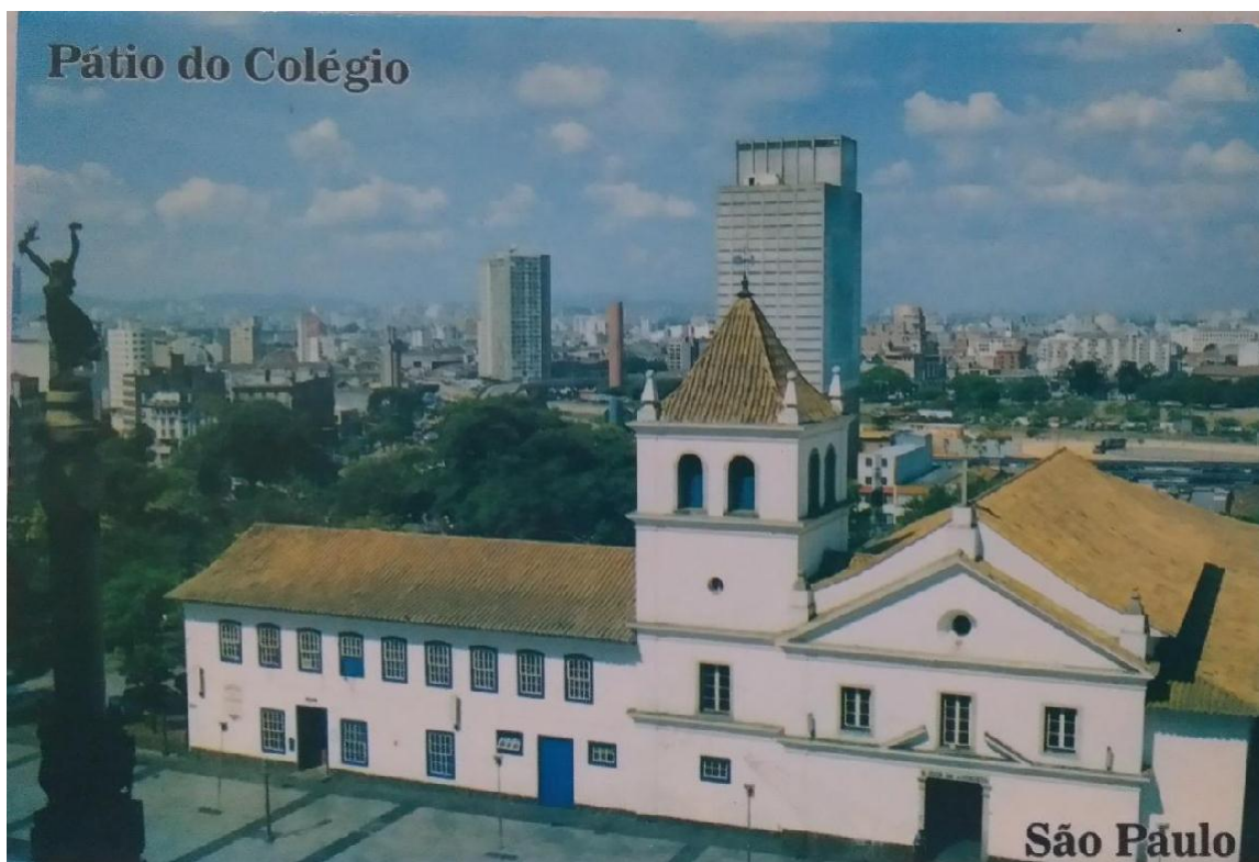
Figura 4 Cartão postal, Brasil Turístico/ São Paulo (s.d)