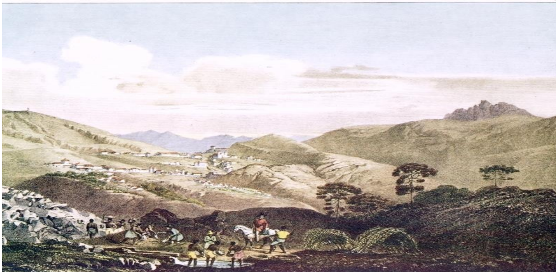
Figura 6

É dentro do contexto histórico da atividade comercial do contrabando da Bahia com a região das Gerais – é que vai aparecer ou surgir a figura controvertida de Manuel Nunes Viana cujas circunstâncias vão levá-lo a condição de chefe dos “emboabas”,