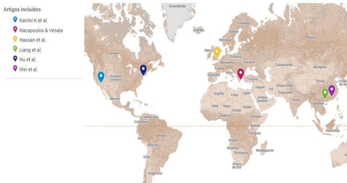
Figura 2. Países dos autores dos estudos incluídos na síntese qualitativa