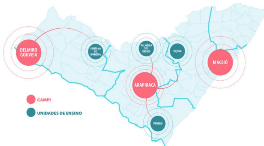
FIGURA 2 – Inserção espacial da UFAL