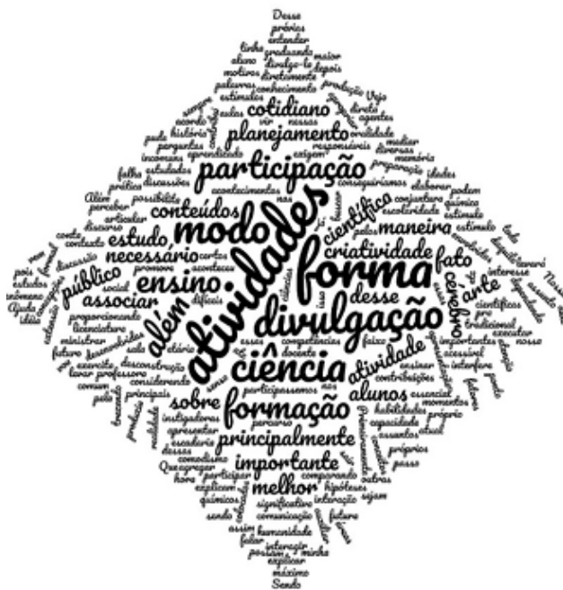
Figura 3 – Nuvens de palavras