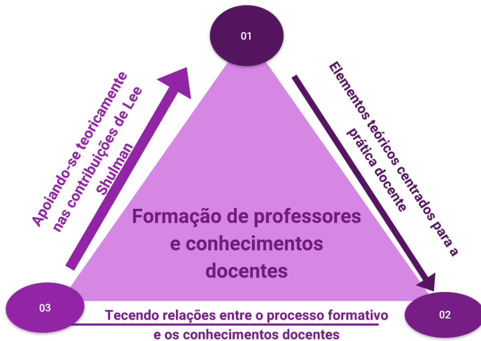
Figura 1: Relação entre formação de professores e o conhecimento docente.

relacionando as ideias dos teóricos sobre a formação e o conhecimento docente e assim, desenvolvendo elementos práticos a partir da ideia de Shulman.