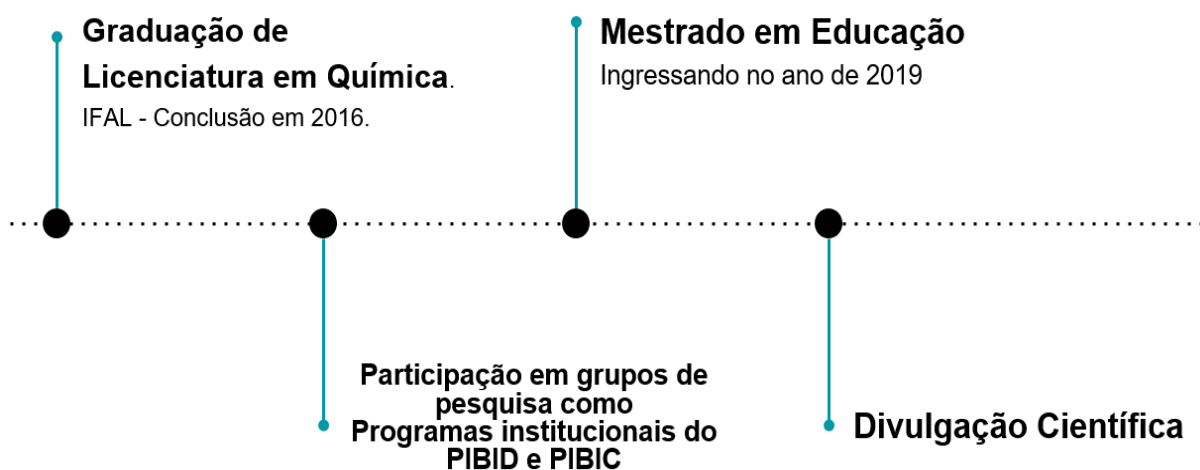
Gráfico 1 – Linha do tempo da minha transição entre a graduação até a pesquisa.

Ao ingressar no mestrado em 2019 me aprofundi nos delineamentos dos estudos da divulgação científica desde o processo histórico, até a relação com a prática docente dos licenciandos em química de uma instituição pública que tomamos como foco para nossa pesquisa, sendo eles um grupo de estudantes que fazem parte de um programa o “PET”. Para demonstrar esse percurso, pode-se observar no gráfico 1, a minha transição entre a graduação até a temática da pesquisa.