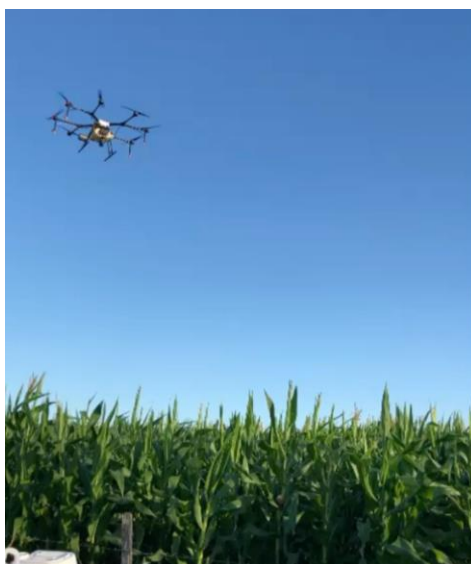
Figura 9: Pulverização de adubo foliar e fungicida na lavoura de milho.

A pulverização agrícola (Figura 9) com o emprego de drones é uma tecnologia em crescimento, visto que ela pode ser integrada a demais métodos de aplicação de produtos fitossanitários (BASSETTO FILHO et al., 2021). Essa atividade exibe características próprias, como: baixo volume de calda, bicos de baixa vazão, gotas mais finas, maior altura da barra e efeito do giro das hélices. Tornando uma pulverização mais específica em relação ao obtido com a pulverização tradicional (BASSETTO FILHO et al., 2021).