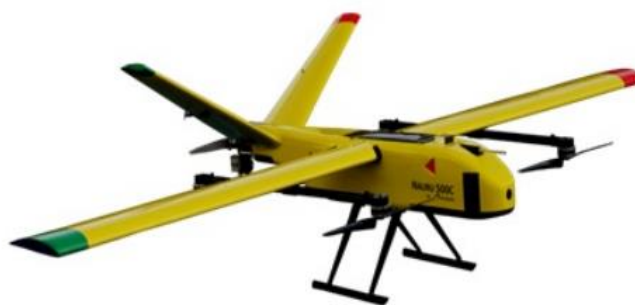
Figura 7: Drone de modelo híbrido.

Com os devidos avanços e pesquisas recentes na área relacionada, Dias (2017) fala que uma terceira categoria drones está disposta no mercado, classificada como híbridos. Esse modelo combina o melhor das duas aeronaves anteriores. O modelo híbrido (Figura 7) é uma aeronave habilitada para decolagem na vertical, logo após isso é capaz de realizar um voo como aviões, por meio da inclinação dos motores ou da fuselagem (LUCHETTI, 2019).