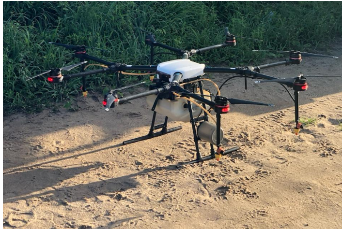
Figura 5: Plataforma multirotora, modelo DJI-T10.