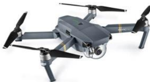
Figura 4: Drone de multirotores.

Os tipos multirotores (Figura 4 e 5) são qualquer aeronave de asa rotativa que contenha mais de um rotor, e que a sustentação para o voo se origine destes rotores, usando o princípio de um helicóptero. As aeronaves multirotores atuais possuem uma classificação quanto ao seu número de rotores e a disposição dos motores em sua estrutura principal como pode ser observado na figura 6.