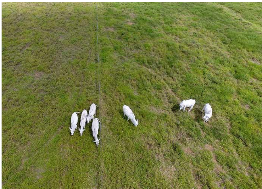
Figura 8: Levantamento aéreo da população de gado por ARP.