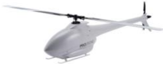
Figura 3: Modelo de drone com rotor único.

São semelhantes a um helicóptero, porém, uma versão muito pequena e sem tripulação. Estando entre os mais comuns do mercado, esse modelo dispõe de um rotor no interior e uma hélice para estabilização, tendo uma ótima eficácia em voos prolongados e em voos pairados (BITTENCUORT, 2022).