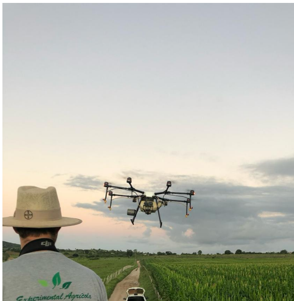
Figura 1: Utilização de ARP para pulverização de defensivos na cultura de milho.

essa tecnologia torna o cultivo mais eficiente e sustentável e vem ganhando cada vez mais espaço, tendo o produtor uma ferramenta de aquisição de dados para uma eficiente e rápida tomada de decisão (ALMEIDA, 2023).