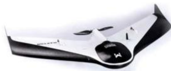
Figura 2: Modelo de drone com asa fixa.

Nesse modelo, como na figura 2, são utilizadas asas como um avião tradicional para dá mais sustentação (BARSANTE, 2020). Dispõem de um motor tipo hélice na parte de trás, o que faz impulsionar esse modelo para a frente. Devido a essas características eles acabam realizando voos em linha reta e com maior período de tempo, já que possui sistema de bateria integrado. Geralmente, eles tendem a ter 80 minutos de autonomia de voo (BITTENCUORT, 2022).