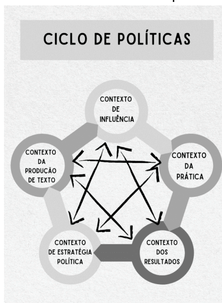
Figura 4 - Ciclo de Políticas Ampliado 2.