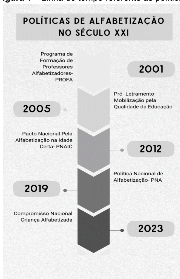
Figura 1 – Linha do tempo referente às políticas.

O foco desta seção se volta a realizar um levantamento sobre as políticas públicas desenvolvidas pelo Ministério da Educação ao longo das duas primeiras décadas do século XXI, no âmbito da alfabetização no Brasil, buscando compreender as concepções teóricas e discursos sobre alfabetização, presentes em cada política. A seguir, apresenta-se uma linha do tempo referente às políticas: