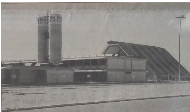
Caic em Maceió tem estrutura mais moderna do país

E, concluída em outubro do mesmo ano: “Já foram concluídas as obras de construção do Centro Integrado de Apoio a Criança (Ciac), localizado no Campus, A.C. Simões da Universidade Federal de Alagoas – Ufal” (JORNAL DE ALAGOAS, Maceió, 14 de outubro de 1992, Ano 83 – nº 243, p. A-5),