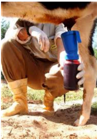
Figura 4 e 5: Manejo mãe-cria, curativo do umbigo do recém-nascido.

O iodo 10% é um bactericida que pode ser facilmente encontrado em farmácias e casas agropecuárias. O objetivo da cura do umbigo é a desidratação do coto umbilical com o colapamento dos vasos sanguíneos e do úraco. Outros produtos como óleo queimado e creolina nunca devem ser utilizados, pois são extremamente cáusticos e irritantes e podem agravar o quadro de inflamação na região. Mata-bicheiras devem ser utilizados apenas quando se observarem larvas de mosca na região (Coelho, 2005).