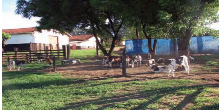
Figura 9: Bezerros em locais arejados, com disponibilidades de sobra.