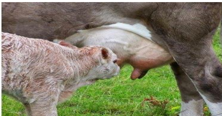
Figura 2: Colostro o primeiro leite secretado pela vaca após o parto.