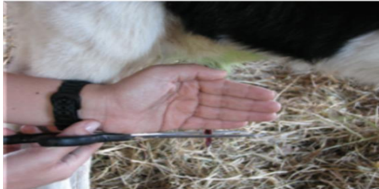
Figura 5: umbigo cortado