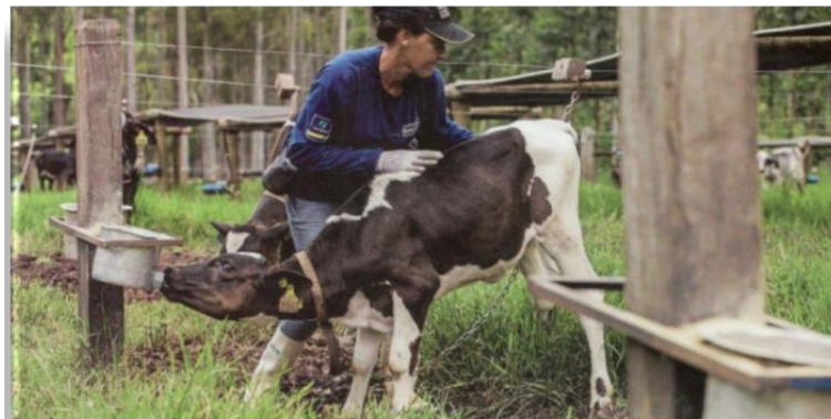
Figura 1: Manejo com a bezerra

A infraestrutura de qualquer propriedade destinada à produção de leite consiste em um conjunto de características próprias e únicas, cujos fatores a serem considerados devem ser avaliados de forma global e interativa, quanto a disponibilidade dos recursos produtivos: terra, capital e mão-de-obra. Este procedimento é essencial para o sucesso na atividade, quer seja ao se iniciar, reestruturar ou promover uma expansão no sistema de produção (EMBRAPA Gado de Leite Sistemas de Produção, 1 ISSN 1678-314X Versão eletrônica 2003).