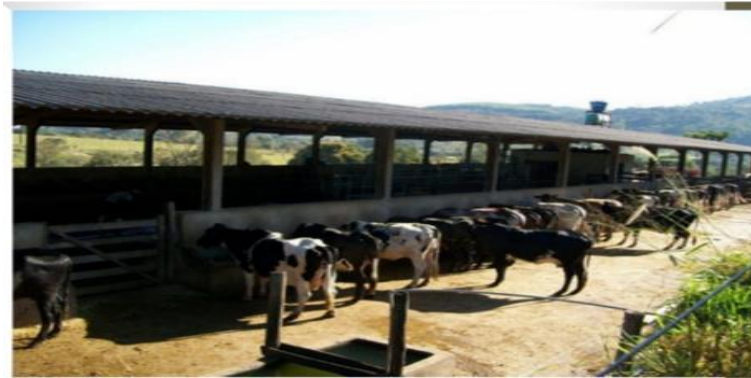
Figura 7: Bezerros em locais arejados, com disponibilidades de sobra e alimentos.