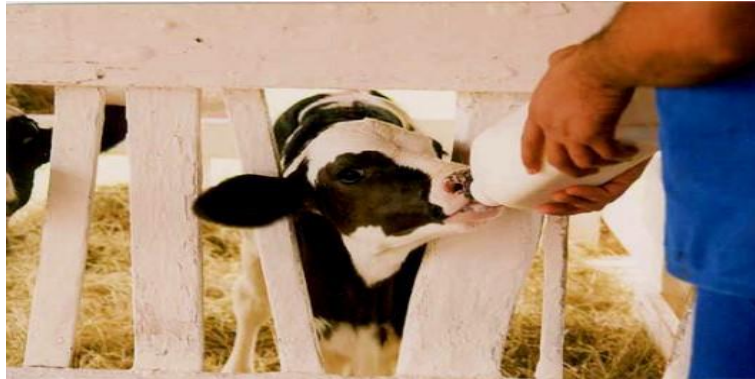
Figura 3: Colostro fornecido na mamadeira.