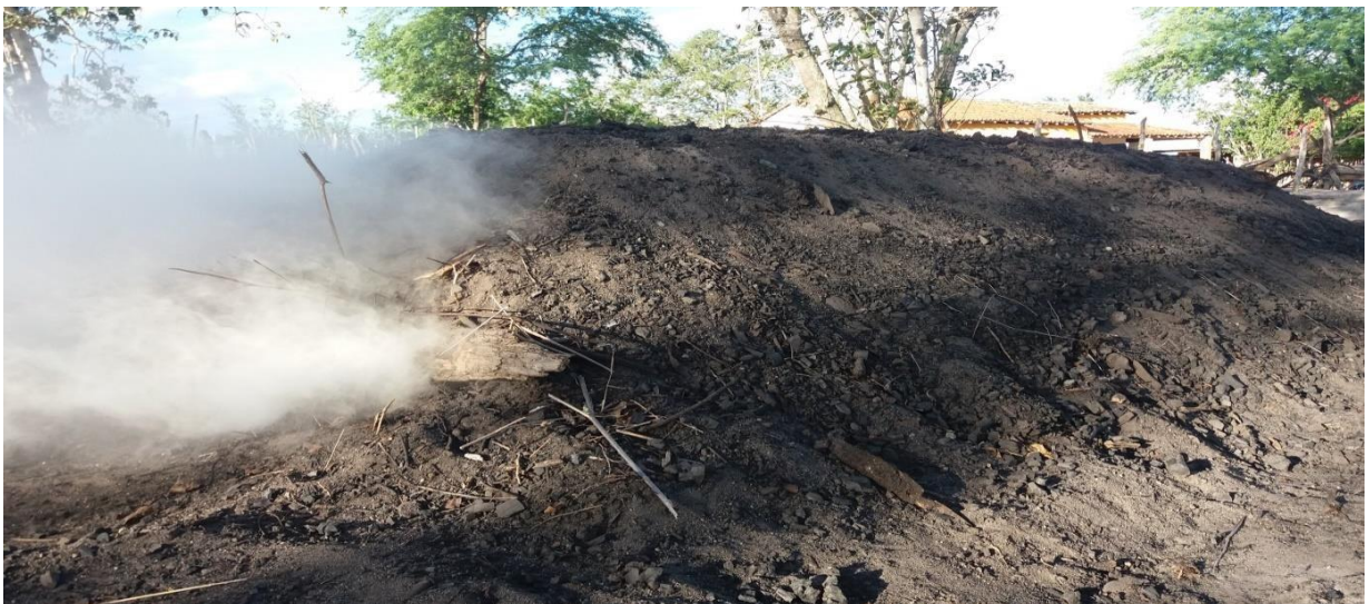
Figura 07: processo de queima da mata caatinga

Dentro desta ótica pode ser percebido que muitas caldeiras ainda resistem com o seu método de trabalho que é a lenha bruta, sendo em muitas situações um consumo de 1 m 3 por hora, com isso o avanço para o desmate da caatinga tende sempre a crescer, visto que a jurema preta, assim como a catingueira é uma das melhores espécies para a questão de geração de calor.