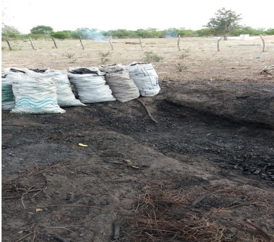
Figura 08: ensacando o calvão para a venda

O teor de umidade é um fator que influencia na friabilidade do carvão vegetal, ou seja, quanto maior o teor de umidade da matéria-prima maior é a quantidade de finos gerados, pois torna os carvões friáveis e quebradiços, gerando material particulado (carbono), também chamado de moinha. A umidade do carvão vegetal influencia nas propriedades de resistência mecânica (COSTA, 2004).