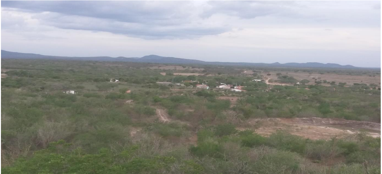
Figura 11: Povoado Pedrão

Diante deste relato pode ser visualizado nas áreas de posse do povoado, que boa parte das áreas de caatinga não existem mais, para fazer a retirada tem que ir mais além para fazer a extração da madeira. O respeito pela mata poucos conhecem, simplesmente desmatam para ter dinheiro para sua sobrevivência.