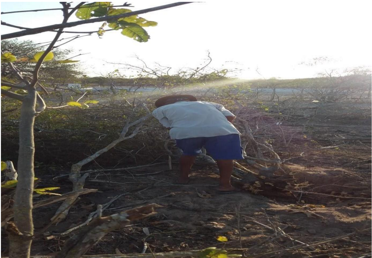
Figura 12: desmate da caatinga