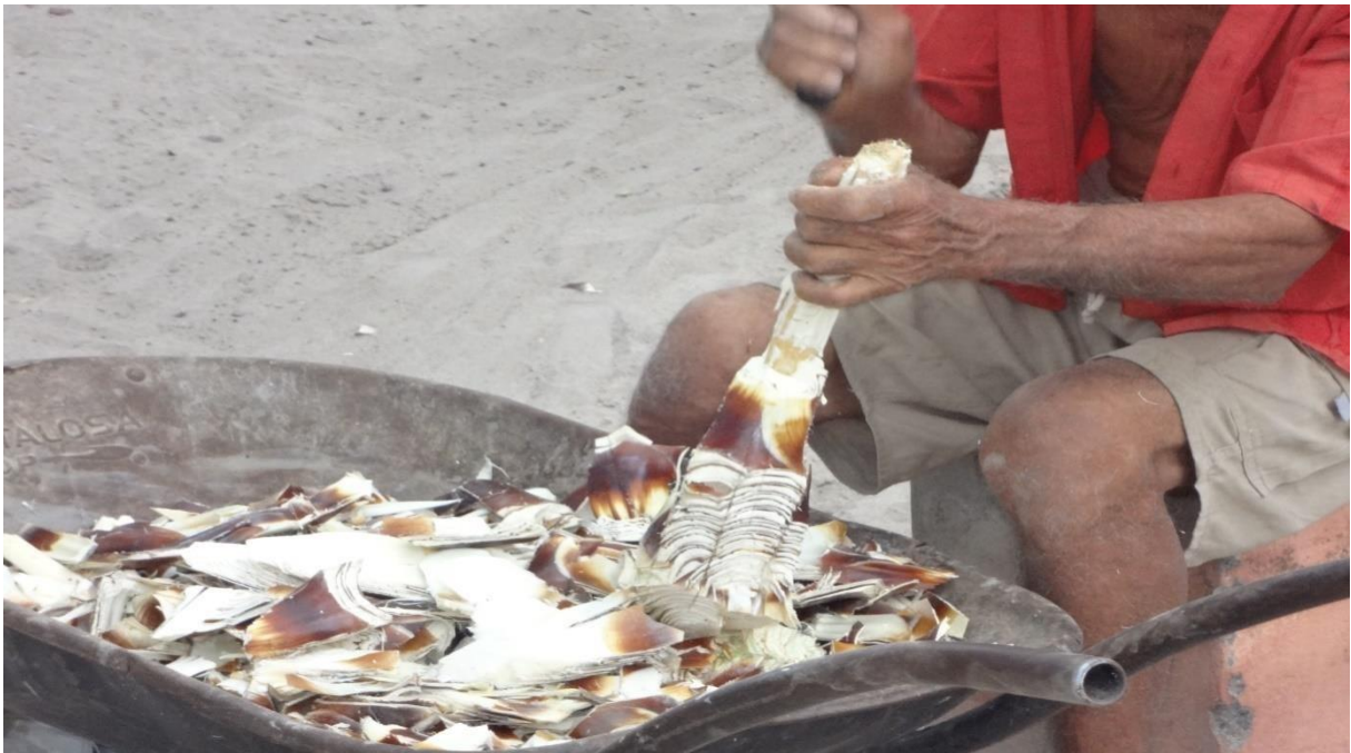
Figura 06: agricultor pinicanando macambira para dar para o gado

Conforme diz Barbosa (2007, p.6), “[...] torna-se necessário que sejam tomadas medidas para a proteção e recuperação do meio-ambiente [...] e criadas alternativas que possam ser geradas condições para que haja uma melhoria nas condições social, econômica e ambiental para os agricultores, especialmente para os agricultores familiares localizados em regiões áridas e semiárida”.