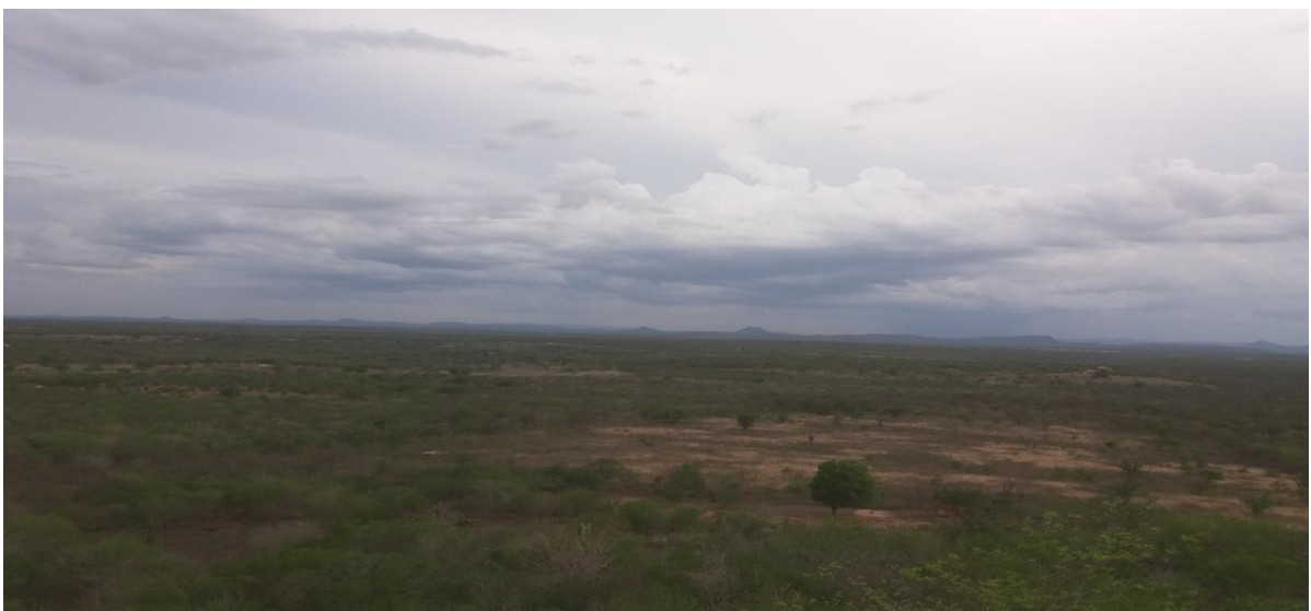
Figura 03: área desmatada no Povoado Pedrão

Na foto abaixo pode-se perceber uma vasta área desmatada para o processo produção de calvão vegetal, ainda muito usado nas casas dos sertanejos, seja para o dia a dia, seja para o final de semana para o uso do churrasco.