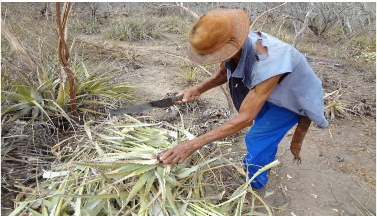
Figura 05: agricultor retirando os espinhos da macambira 5

O trabalho é complexo para esse tipo de atividade. A macambira tem espinhos altamente cortante, o cuidado deve ser constante para a retirada desta planta do bioma caatinga. O sertanejo manuseia com cuidado, mas mesmo assim consegue se ferir. O uso de técnicas para a retirada passa de geração em geração com isso não morre a tradição.