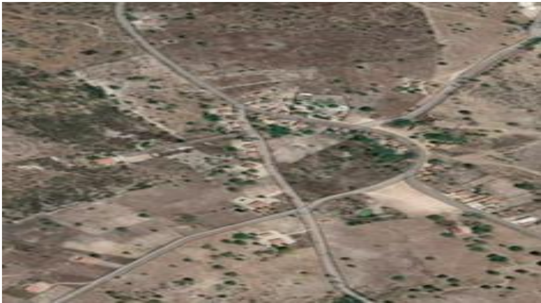
Figura 10: povoado Pedrão vista superior

A conservação ainda é um caminho correto para a garantia da vida, com uma promoção em educação ambiental para que a população possa realmente aprender que é essencial proteger o bioma caatinga, para que exista áreas verdes, que a extração das áreas verdes podem acontecer, mas de forma ordenada para que não deixe acabar o bioma.