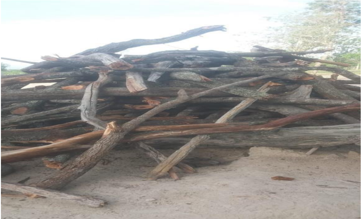
Figura 13: Madeira pronta para vender

Os primeiros animais aqui da região, já existia na fazenda, eles trouxeram, mas os entrevistados não sabem de onde. O resultado deste avanço na agricultura, assim como na produção de animais, com isso o povoado e todo o seu entorno tem grandes áreas desmatadas.