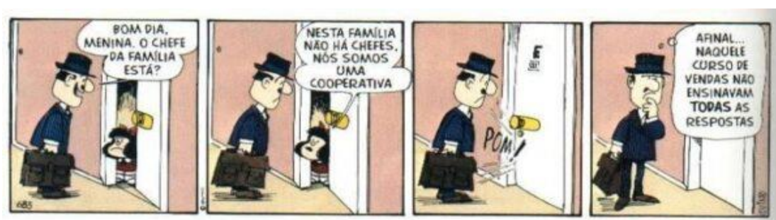
Figura 5- Tirinha da Mafalda 5.