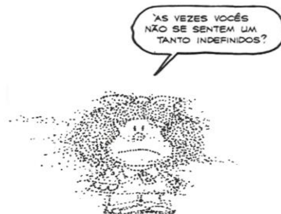
Figura 4 – Tirinha da Mafalda 4