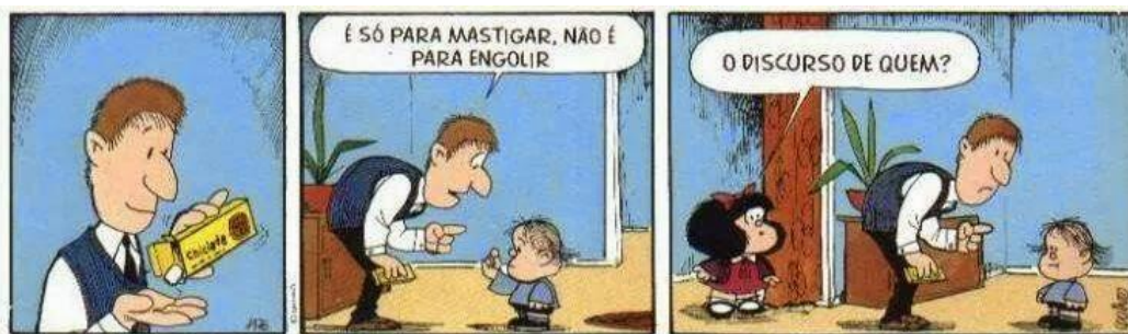
Figura 1- Tirinha da Mafalda 1