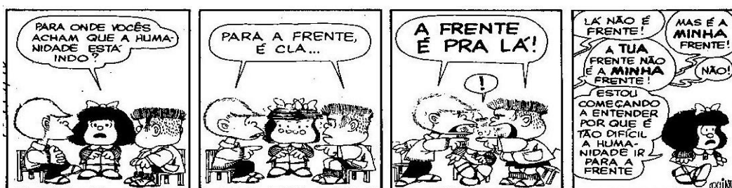
Figura 6 – Tirinha da Mafalda 6