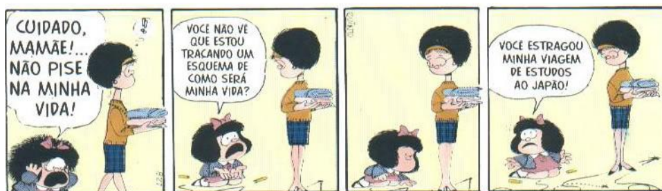
Figura 2 – Tirinha da Mafalda 2