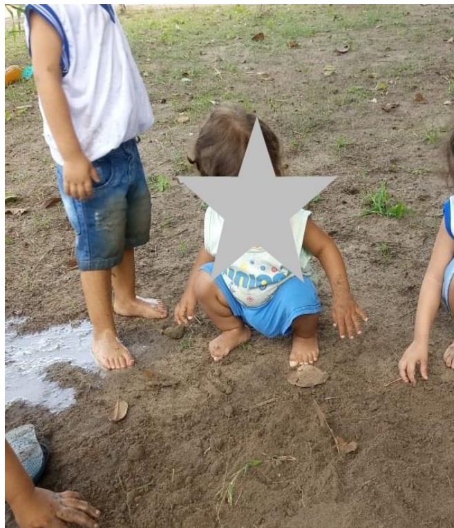
Figura 2 – Proposta brincante com terra e água