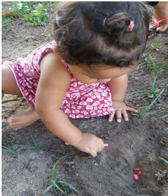
Figura 3 – Interação de criança com a terra

Apresentamos a seguir, algumas práticas pedagógicas realizadas com crianças de até 3 anos. Essas propostas fazem parte da minha prática enquanto educadora infantil, na qual pude observar e vivenciar situações de aprendizagens nos momentos de interação entre as crianças, das crianças com os adultos e das crianças com os constituintes da natureza, essas práticas foram realizadas antes dessa pesquisa, de modo que colocamos em seguida as adequações pensadas a partir dos estudos realizados, de acordo com a perspectiva da pedagogia histórico-crítica.