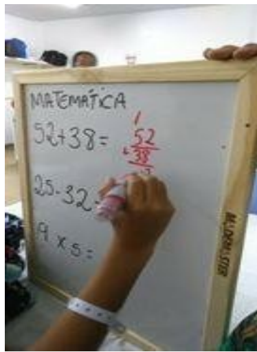
Figura 4- Trabalho com lousa/armando as operações

Então, para trabalhar o campo aditivo e multiplicativo, aproveitamos e usamos a lousa para que chamasse mais atenção da criança e para a construção da resposta ser visualmente melhor.