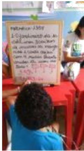
Figura 2- Trabalho com lousa branca

Os problemas envolviam as quatro operações, porém só usávamos aquela que a criança que esteja sendo assistida compreendesse. Após a aprendizagem daquela operação íamos aumentando o nível de complexidade e acrescentando outras operações. Abaixo a figura 2, mostra como era feito esse exercício, diante de algumas necessidades.