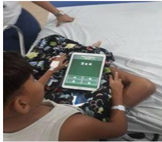
Figura 1- Trabalho com o tablet