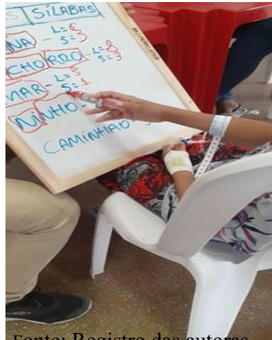
Figura 5- Interdisciplinaridade português/matemática.