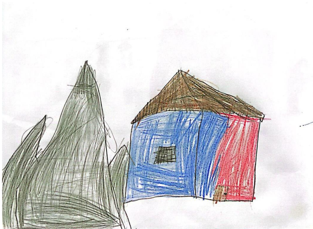
Figura 1 – Ilustração 1.