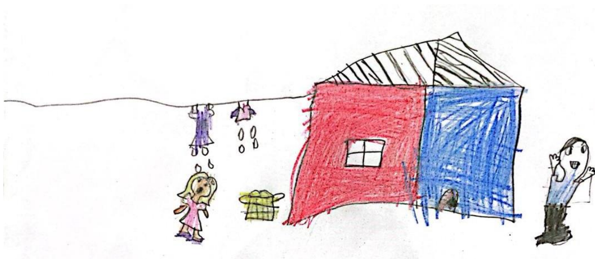
Figura 2 – Ilustração 2.

Em uma pequena cidade do interior de Alagoas, vive um menino muito, muito sapeca. Seu nome é Natan.