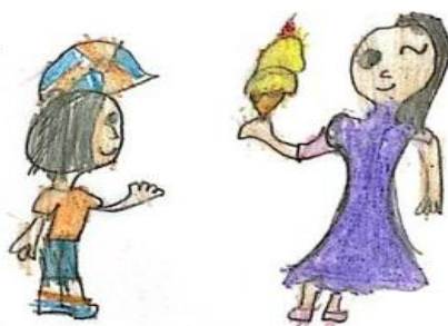
Figura 9 – Ilustração 9.