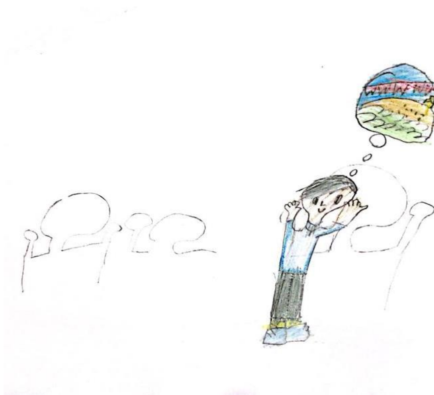
Figura 19 – Ilustração 19.

Hum... Depois dessa notícia, só houve festa na casa dos chicos e não se falava em outra coisa a não ser na viagem que, em breve, os três Francisco fariam juntos para conhecer o Velho Chico.