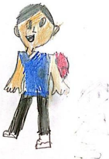
Figura 15 – Ilustração 15.