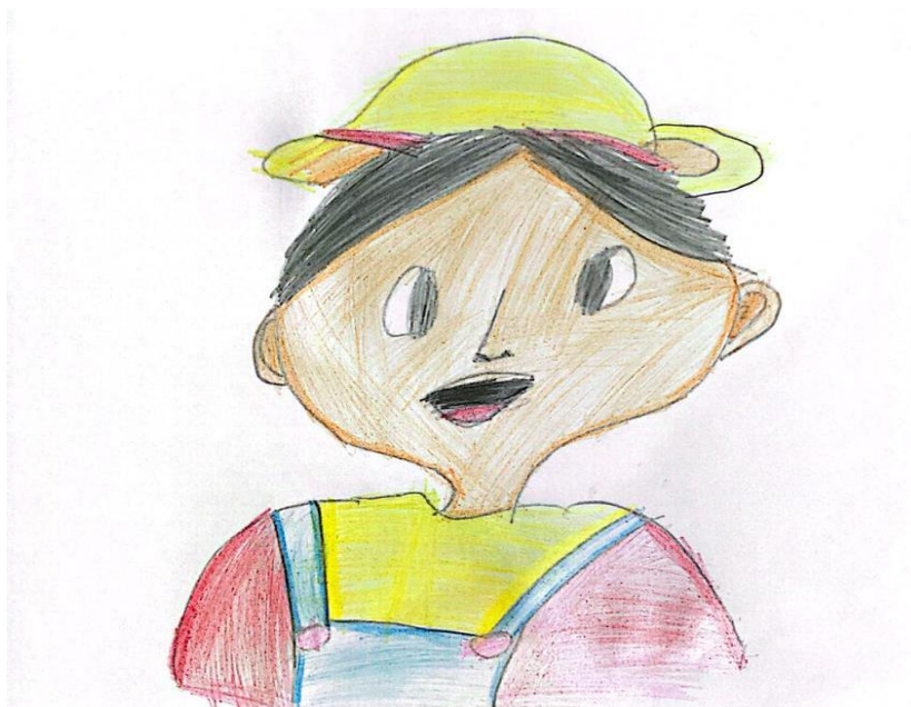
Figura 17 – Ilustração 17.

O pai das crianças ficou muito feliz em receber a notícia, contudo, o mais legal as crianças ainda não tinham contado para ele.