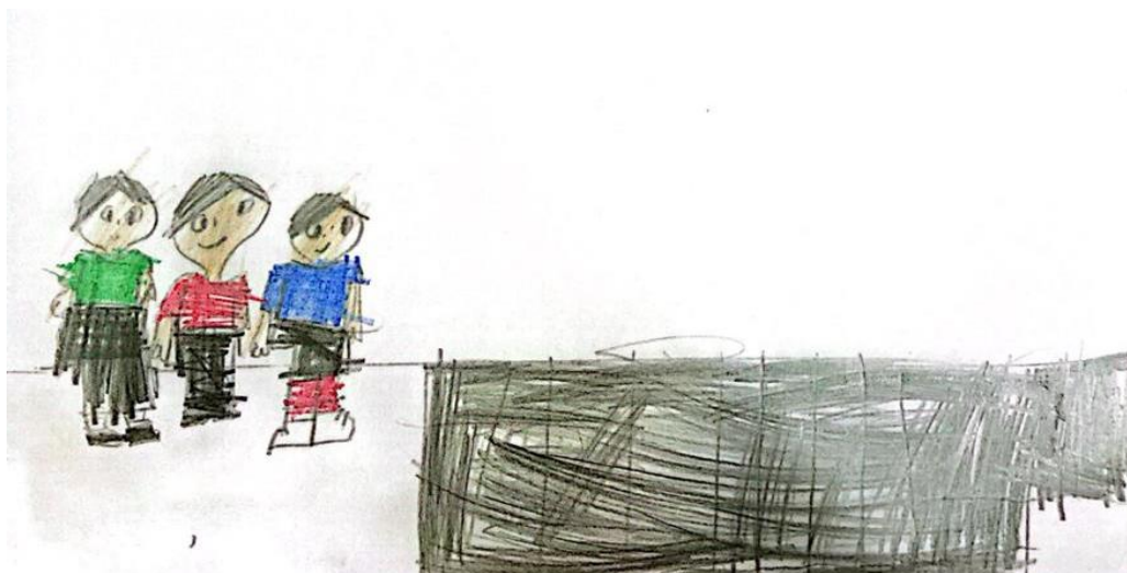
Figura 11 – Ilustração 11.

Jota e Jal são dois meninos de sobrenome Francisco. Todos os dias, no fim de tarde, eles sentam juntos com seu pai, que também se chama Francisco, na calçada de casa, para ouvir histórias.