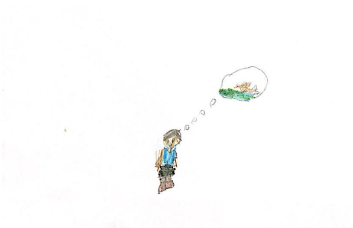
Figura 14 – Ilustração 14.

As crianças nunca desistiram desse sonho, e sempre que ouviam as histórias de seu pai, por meio de desenhos, imaginavam como seria bom nadar nele.