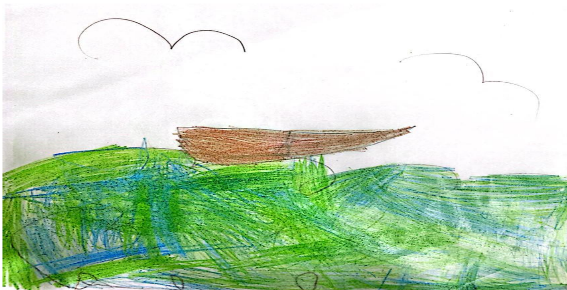
Figura 12 – Ilustração 12.

As histórias que eles mais gostam de ouvir de seu pai é sobre um rio gigante, um dos maiores do Brasil, que tem como nome o sobrenome deles: Rio São Francisco.