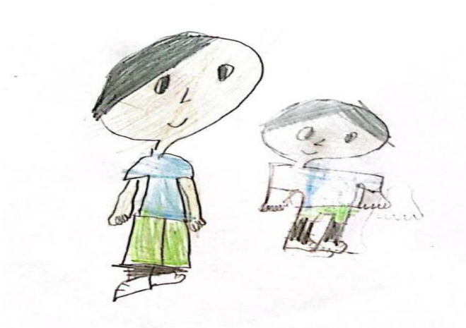
Figura 18 – Ilustração 18.

Jota, muito alegre, chega perto do seu pai, e para a surpresa dele fala que eles só podem ir para o passeio se um adulto os acompanhar.