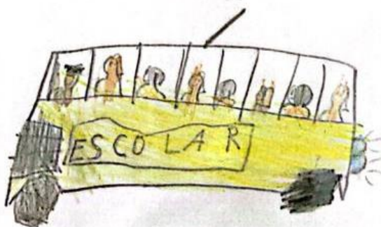
Figura 16 – Ilustração 16.

A cidade tem nome de Penedo, que ajuda a contar um pouco sobre a história de Alagoas, estado onde eles vivem, e por ela passa o rio São Francisco, que tanto os meninos queriam conhecer.