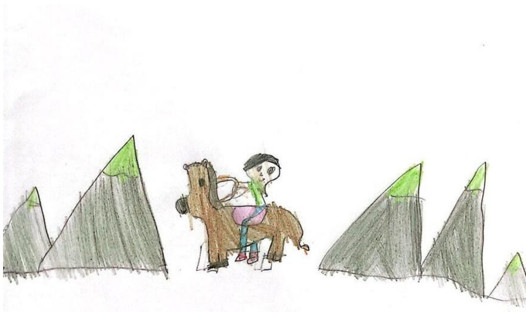
Figura 7 – Ilustração 7.