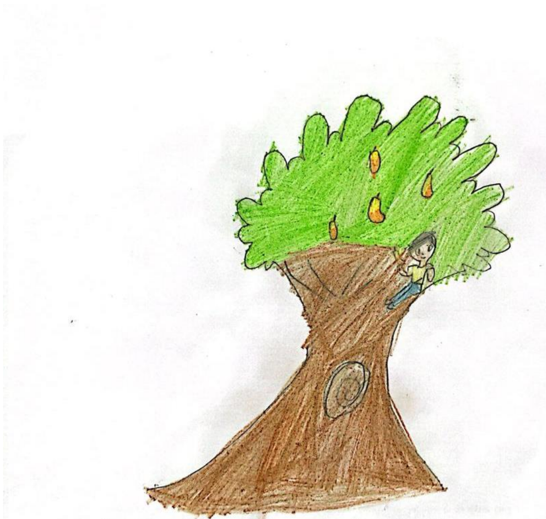
Figura 3 – Ilustração 3.

Natan tinha muitos amigos e junto com eles gostava de subir nas árvores de seu quintal para colher mangas, seriguelas e pitomba.