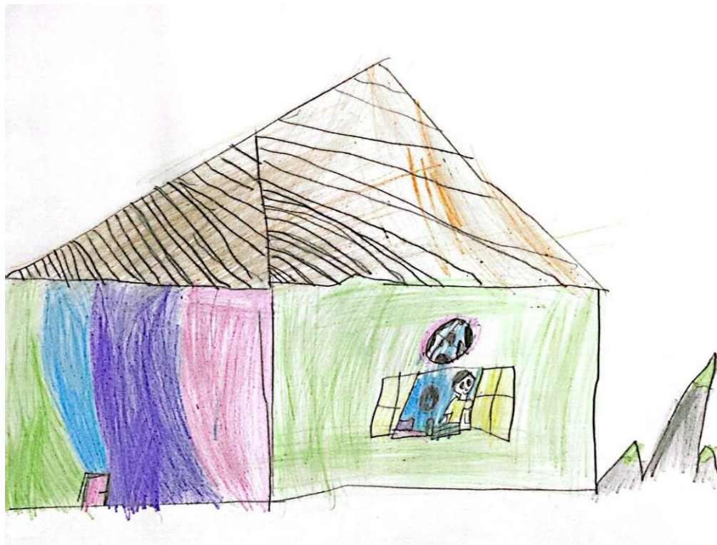
Figura 5 – Ilustração 5.