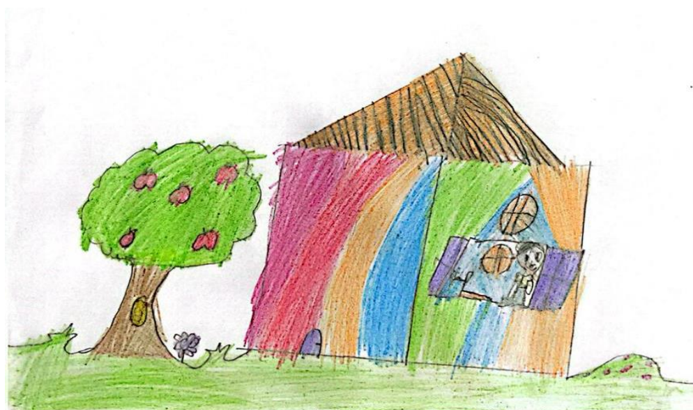
Figura 6 – Ilustração 6.

Natan senta todos as manhãs na janela de sua casa e observa de longe as árvores que lá estão.