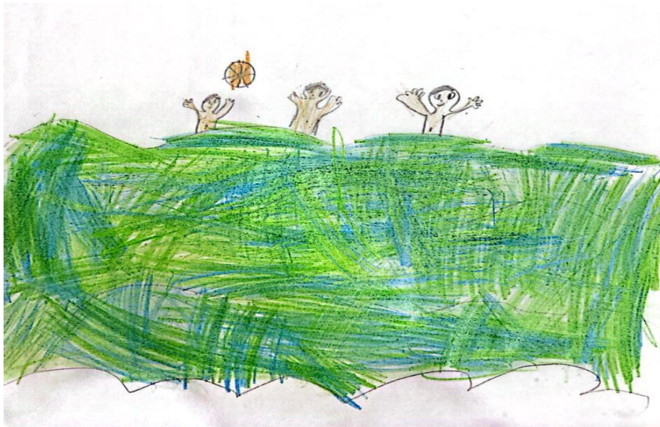
Figura 10 – Ilustração 10.