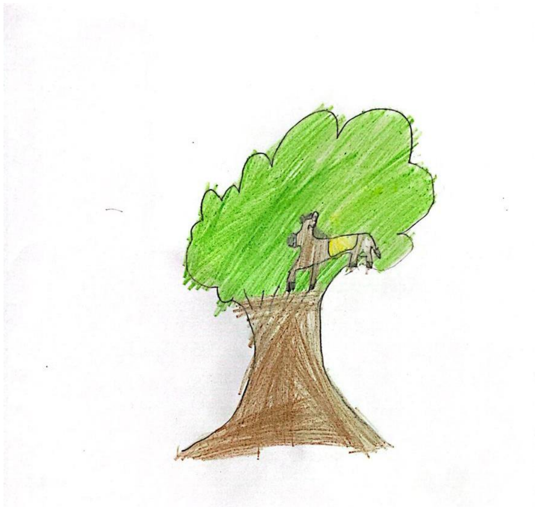
Figura 4 – Ilustração 4.