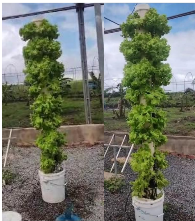
Figura 13 - Visão da coluna nos dias 14 (A) e 15/06/2025 (B), antes da colheita.