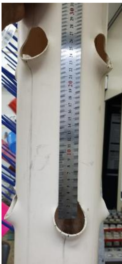
Figura 11 - Distância entre os centros dos furos.