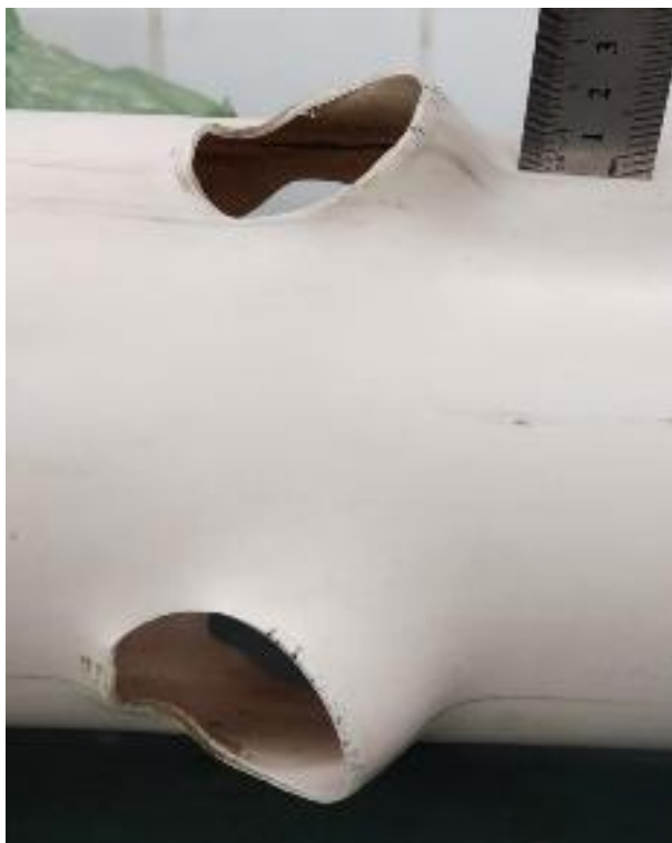
Figura 5 - Circunferência da coluna e ângulo de 45° do furo para acomodação dos net-potes.