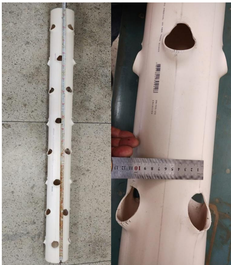
Figura 4 - Coluna de produção (A) e linhas divisórias dos furos da coluna (B).

A coluna de produção com altura (h) de 2050 mm, que foi dividida em oito áreas com linhas de centro de 60 mm para a acomodação alternada dos andares de produção.