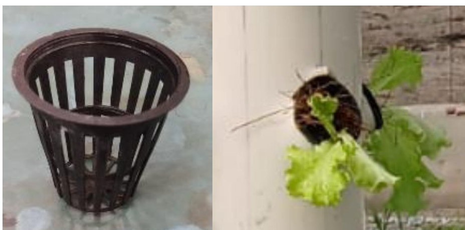
Figura 10 - net-pots (A) e net-pot com fibra de coco e a planta na coluna (B).

Os net-pots têm diâmetro interno de 47 mm, diâmetro externo de 54 mm e altura de 51 mm. Utilizamos fibra de coco como substrato inerte para proteção das raízes.