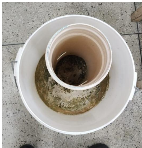
Figura 1 - Visão aérea do balde com a base de concreto e o tubo de 150 mm.

A base do sistema foi confeccionada com um balde de produtos alimentícios usado, adquirido em loja de produtos recicláveis. O cano de 150 mm, de base para o encaixe da coluna de produção, foi adquirido em loja de material de construção. Foi fixado no balde por concretagem de 10 cm, para suportar o peso e a velocidade do vento. O concreto foi feito na proporção de 2 x 2 x 2, ou seja, duas medidas de areia, duas de brita zero e dois quilos de cimento, também adquiridos em lojas de materiais de construção. Diâmetro do balde: 355 mm. Diâmetro do cano: 150 mm.