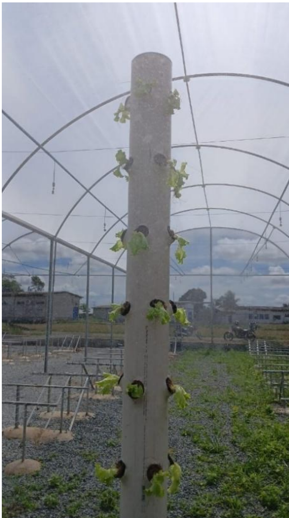
Figura 12 - visão geral da coluna após montagem e plantio