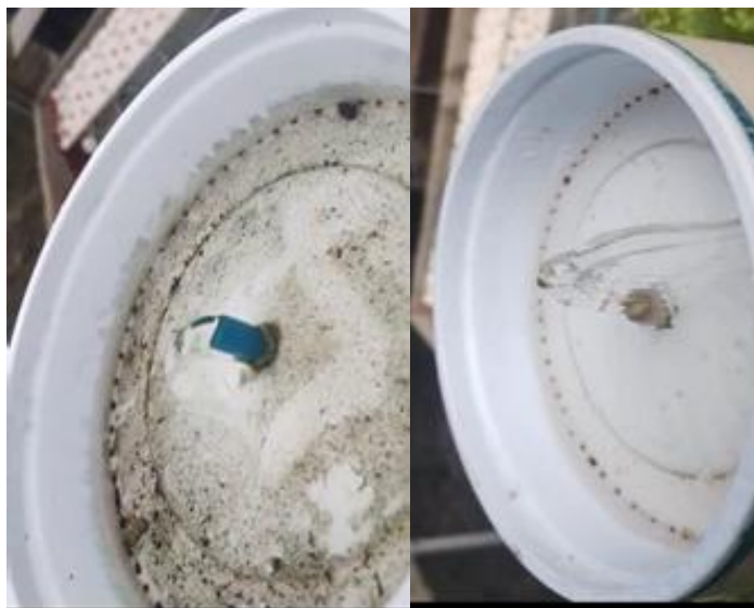
Figura 9 - Vazão da primeira bomba (A) e Vazão da segunda bomba (B).