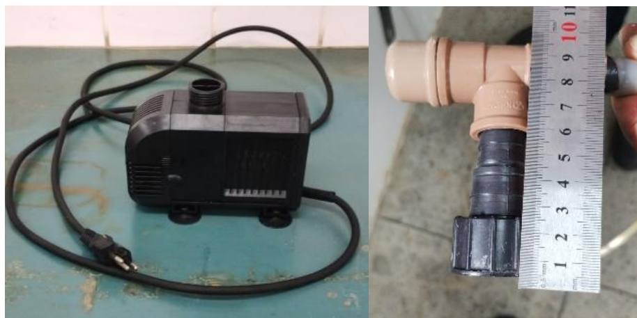
Figura 8 - segunda bomba (A), conector bomba/mangueira (B).

A segunda bomba de 3 m de H manométrica y 3000 \text{ L h}^{-1} , e a segunda mangueira com H de 2500 mm, e o segundo conector com H de 90 mm.