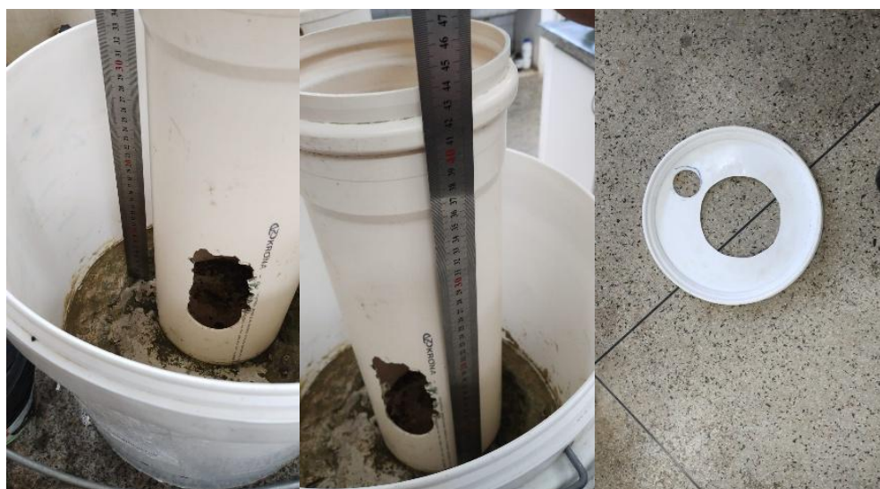
Figura 3 - Altura da base da coluna em relação à base de concreto (A e B) e tampa do balde com os cortes (C).

A altura (h) interna do balde é de 300 mm, a altura (h) do tubo até a base de concreto é de 440 mm, o volume do balde é de exatamente 25 litros, sendo que esses litros foram mensurados com uma proveta de 1 litro, e a tampa foi utilizada para proteger a solução nutritiva. Foram feitos dois orifícios: um de 150 mm para passar a base do cone e outro de 40 mm para passagem do cabo elétrico e manutenção da solução.