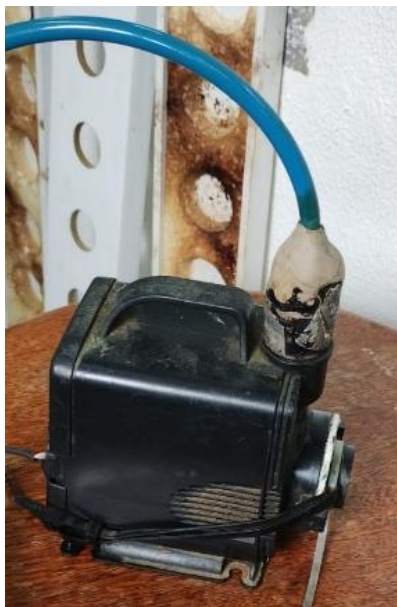
Figura 7 - Primeira bomba.

A primeira bomba com vazão de 3000 \text{ L h}^{-1} e altura manométrica de 3 m, e a primeira mangueira de 2600 mm com o conector.