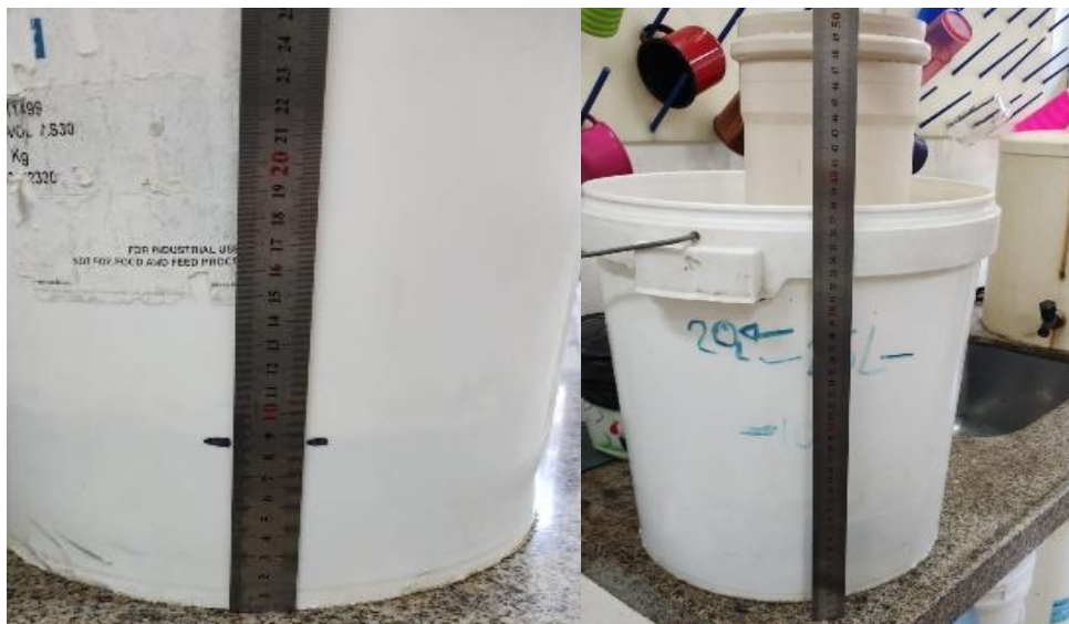
Figura 2 - Altura de base e concreto (A) e altura do balde (B).

Base de concreto de 85 mm, h do balde 380 mm e do tubo da base de 520 mm.