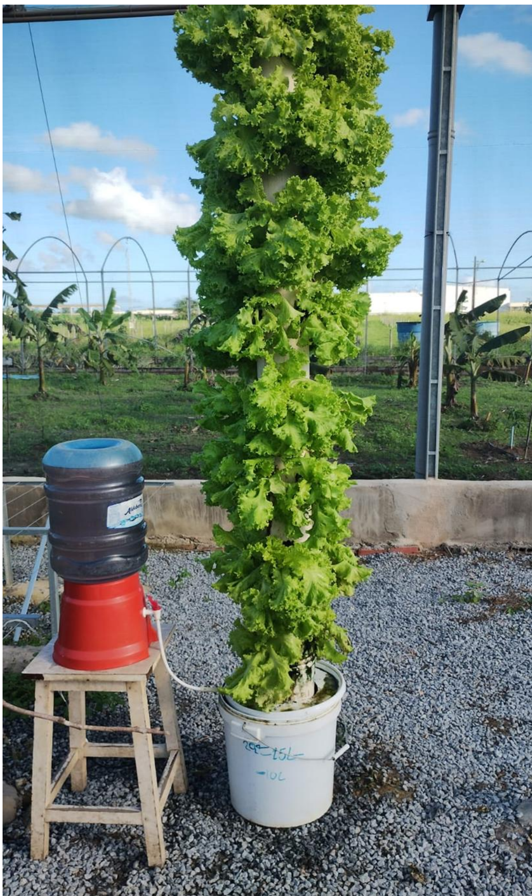
Figura 14- Visão da coluna mais a estrutura auxiliar um dia antes da colheita.