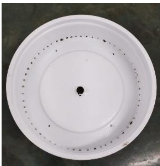
Figura 6 - Chuveiro de irrigação.

O chuveiro para irrigação interna da coluna foi confeccionado com embalagem de doce de goiaba, com diâmetro interno de 140 mm e diâmetro externo de 150 mm, com o furo no centro para passagem da mangueira e furos radiais para a distribuição da solução nutritiva.