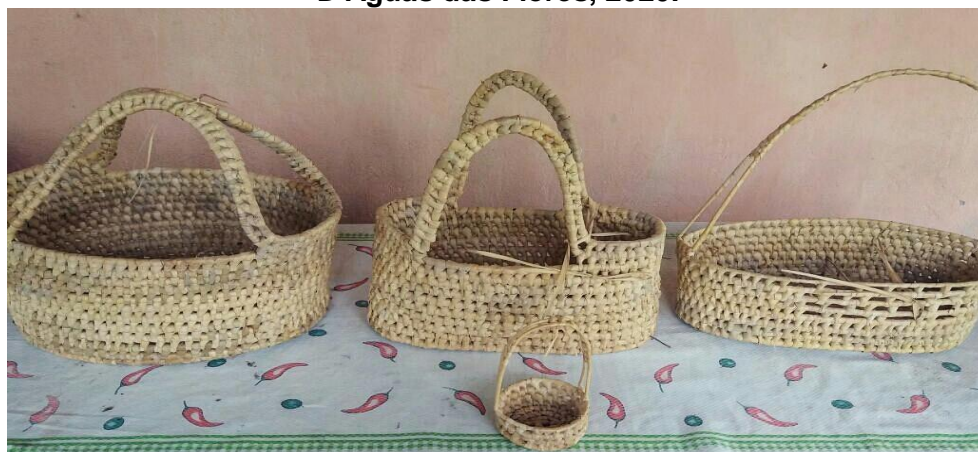
Figura 3: Cestas de palha de coqueiro, do grupo Anny Artesanato em Olho D'Águas das Flores, 2020.

Deste modo, a coleta da palha e posteriormente a elaboração das peças, pressupõem um modelo ecologicamente sustentável, onde se conserva a natureza tirando apenas os instrumentos de trabalho sem modificar sua localidade. Conforme apresenta a imagem abaixo.