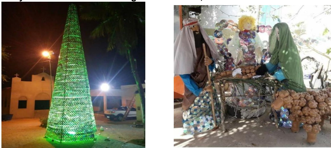
Foto 3 e 4: Árvore de Natal e o Presépio feitos de CD's e DVD's , do grupo Anny Artesanato em Olho D'Águas das Flores, 2020.