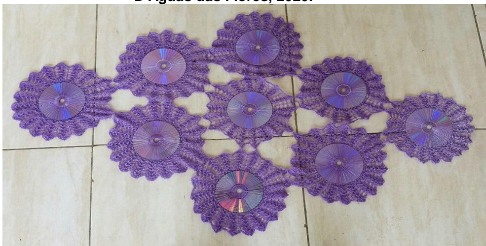
Figura 4: Toalha feita de CD e crochê, do grupo Anny Artesanato em Olho D'Águas das Flores, 2020.

As produtoras perceberam o potencial que os produtos têm e após sua utilização realizaram sua criatividade para elaborar as peças a partir da reutilização. Gerando renda e agregando valor econômico onde muitos não veem possibilidades., como podemos observar na Figura 4.