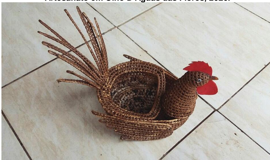
Figura 2: Galo feito de palha em forma de depósito de ovos, do grupo Anny Artesanato em Olho D'Águas das Flores, 2020.

Através da criatividade, muitas artesãs produzem peças mais elaboradas com formas e cores diferentes agregando mais valor ao produto, como podemos observar na Figura 2.