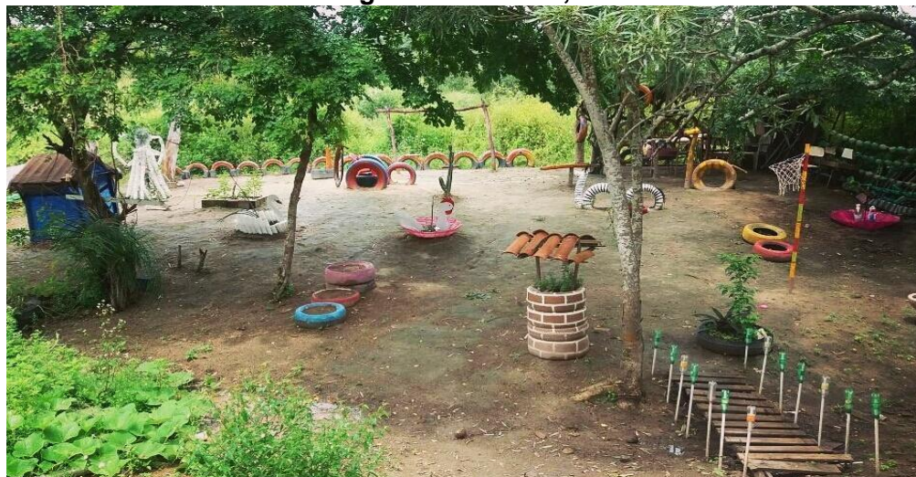
Figura 5: Parque infantil feito de material reutilizado, do grupo Anny Artesanato em Olho D'Águas das Flores, 2021.