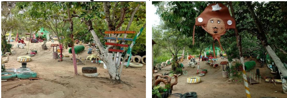
Foto 1 e 2: Parque infantil feito de material reutilizado, do grupo Anny Artesanato em Olho D'Águas das Flores, 2020.