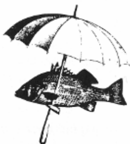
Figura 1 – Paradoxos

FONTE: Eduardo Galeano, O Livro dos abraços , 2020.