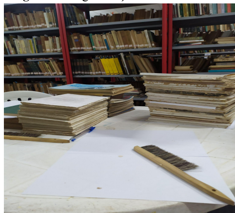
Figura 1 - Higienização e divisão do acervo

Durante a separação e a higienização dos materiais, precisei ter muito cuidado e atenção com as obras/documentos, pois devido aos acontecimentos decorrentes das chuvas, alguns documentos apresentaram-se muito danificados, com avarias, principalmente folhas soltas e lombadas deterioradas.