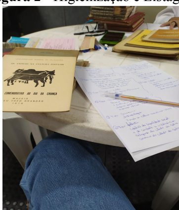
Figura 2 - Higienização e Listagem