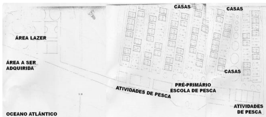
Figura 5 – Projeto Pascoal: