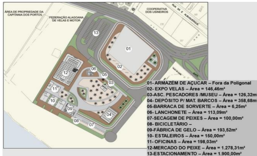
Figura 7 – Configuração do Centro Pesqueiro: