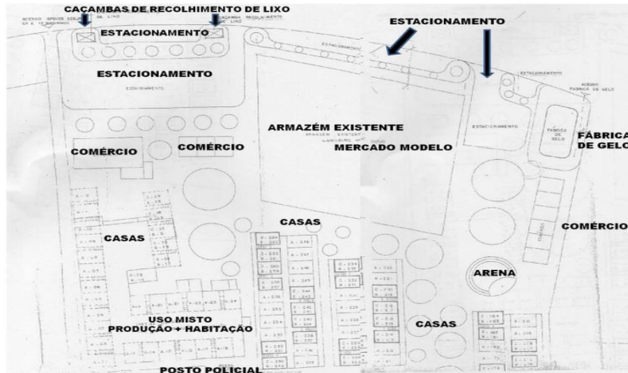
Figura 4 – Projeto Pascoal: