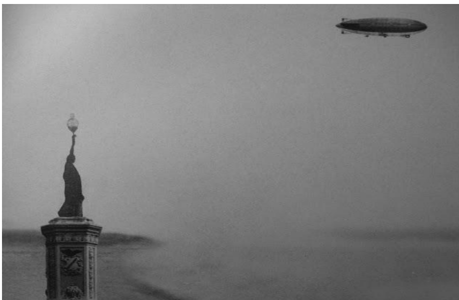
Figuras 1 e 2 – Vista da Praça Dezoito de Copacabana