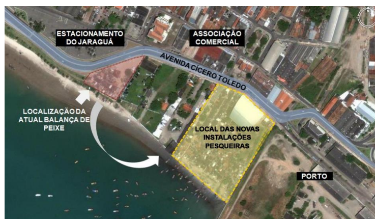
Figura 6 – Localização do Centro Pesqueiro (em amarelo e vermelho):