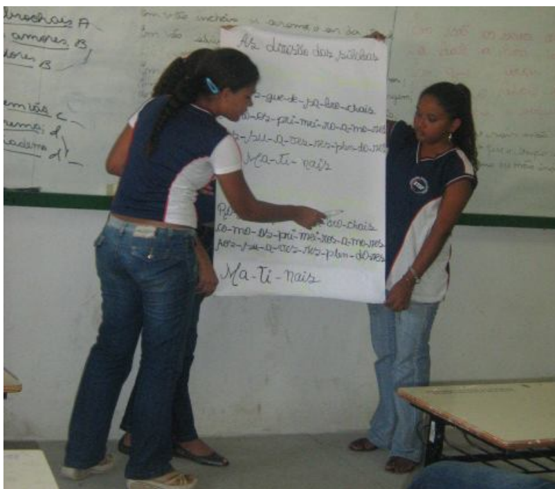
Fonte: Dados da pesquisa (alunas apresentando a estrutura do poema “As Rosas”, na sala de aula)

Equipe apresentando e explicando a estrutura irregular do poema “As Rosas” de Machado de Assis. Divisão das palavras e as rimas, os versos curtos, médios e longos.