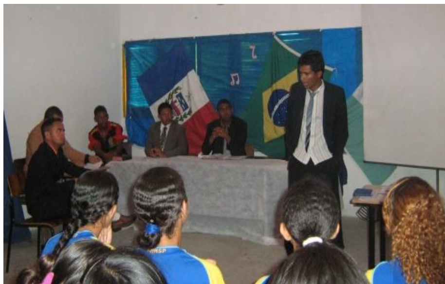
Fonte: Dados da pesquisa – Sessão de júri – alunos representam diversos papéis (advogado de acusação, advogado de defesa, corpo de jurados e juiz) na simulação do julgamento da ré Capitu.