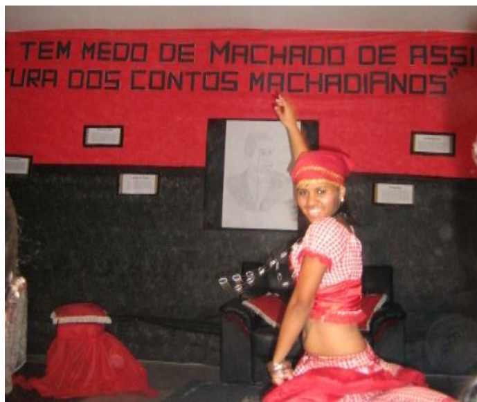
Fonte: Dados da pesquisa (aluna dançando com trajes da Cartomante)