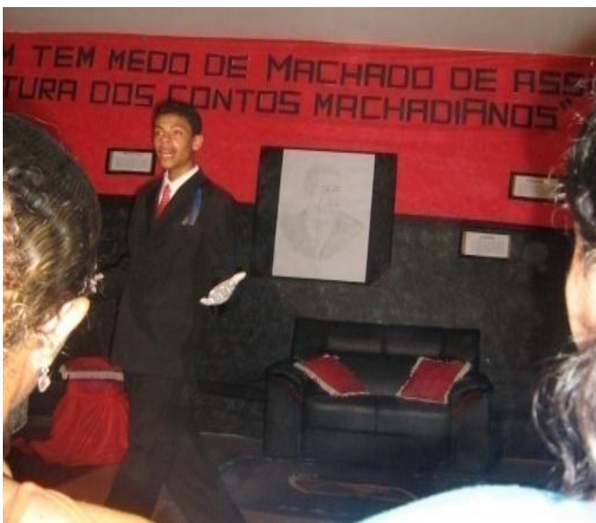
(aluno representando o Sr. Nogueira do conto A Missa do Galo)

Dramatização dos contos machadianos – A Igreja do Diabo, A Missa do Galo, A Cartomante.