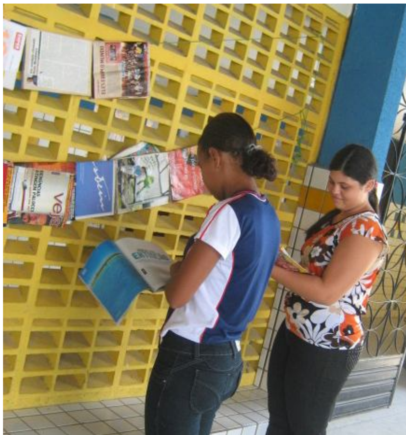
alunas lendo as revistas do varal de leitura