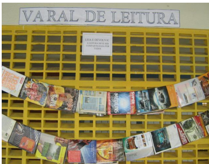
Fonte: Dados da pesquisa - varal de incentivo a leitura