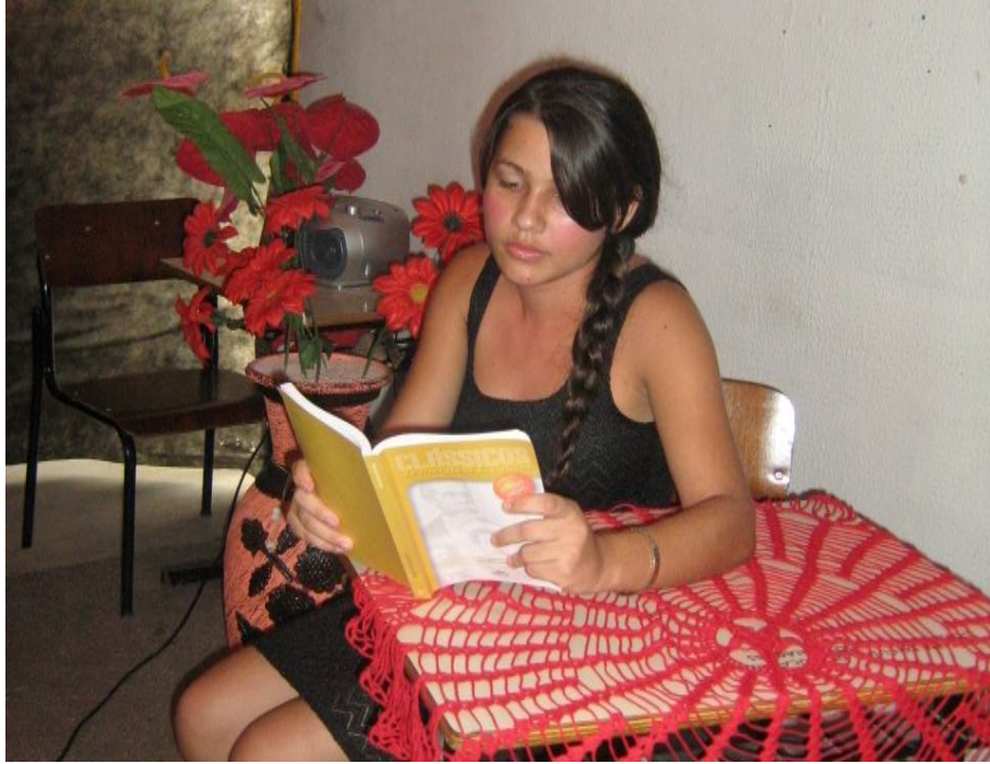
Fonte: Dados da pesquisa – aluna representa Carolina lendo um livro