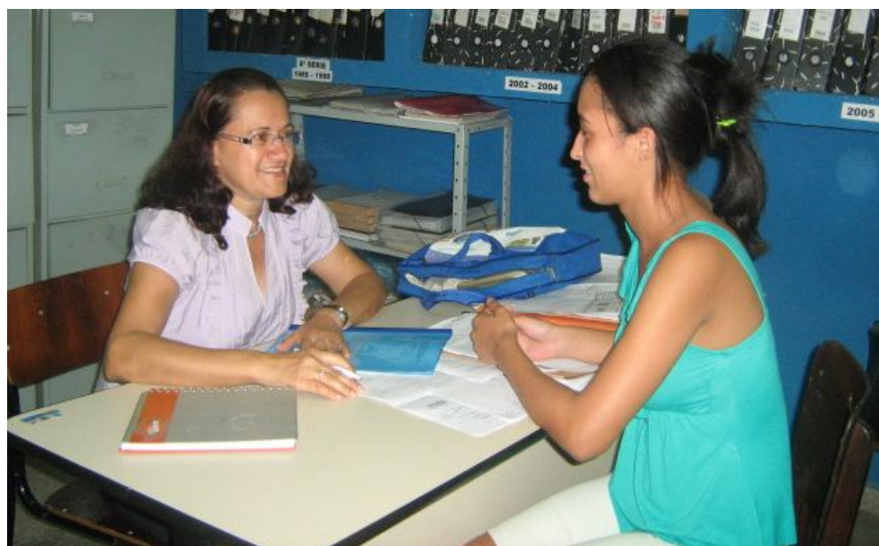
Fonte: Dados da pesquisa - Entrevistas