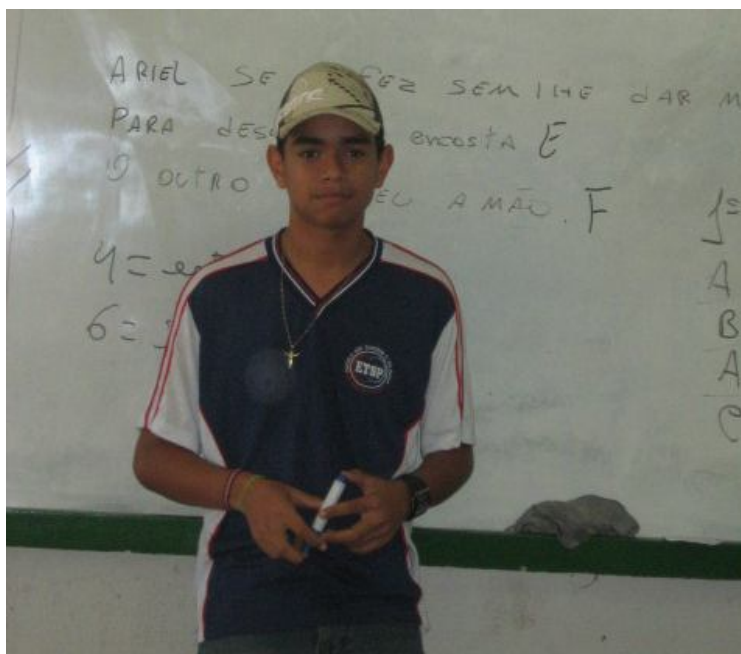
(aluno apresenta estudo sobre poema, na sala de aula)

Apresentação e socialização dos estudos das obras de Machado de Assis (poesias e poemas).