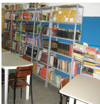
Figura 1: Sala da Biblioteca

Fonte: Dados da pesquisa/2008 - Biblioteca