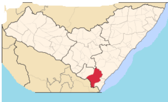
Mapa 1 - Estado de Alagoas destacando Penedo 2 .

A cidade de Penedo localiza-se na região do Baixo São Francisco alagoano, distante, aproximadamente, a 146 Km da cidade de Maceió, capital de Alagoas. Sua população, estimada pelo Instituto Brasileiro de Geografia e Estatística (IBGE) em 2018, era de 63.516 habitantes.