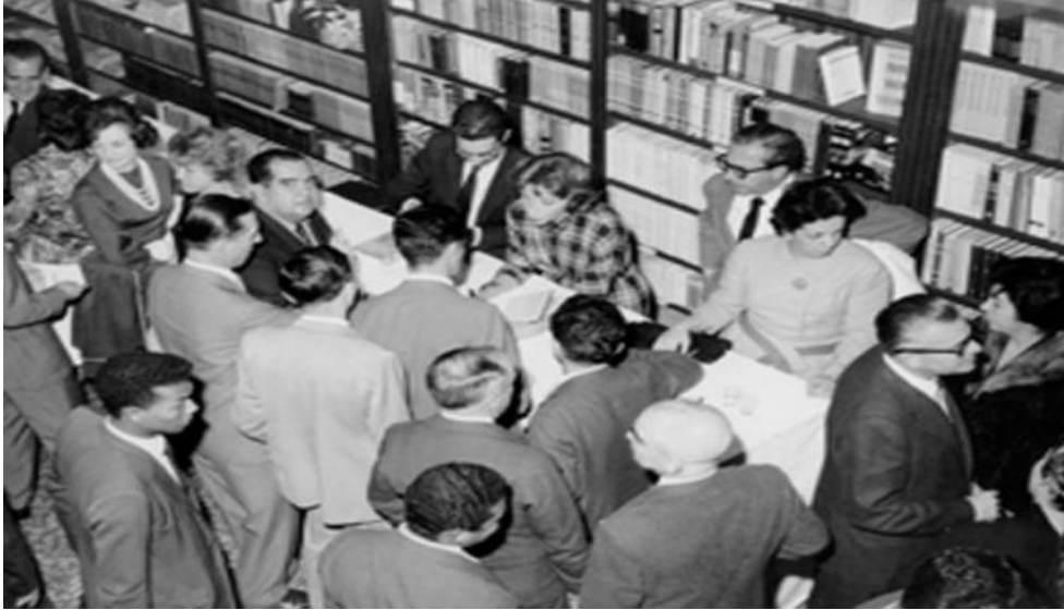
Figura 8 – Clarice Lispector autografando o livro A maçã no escuro