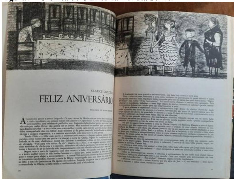
Figura 9 - Crônica de Clarice na Revista Senhor

Clarice também trabalhava em reportagem, entrevistas, noticiários, o que representava bastante o novo lugar ocupado pelos escritores. Os escritores consagrados ocuparam os suplementos literários e o restante do jornal era produzido pelos profissionais com formação técnica que saíam das universidades. Os jornais de notícia passaram a dominar o perfil jornalístico da década de 1960, mas existiam vários periódicos, tais como a revista Senhor , que ainda abrigava muitos escritores. Na época, os suplementos literários eram tão importantes que os primeiros cientistas que compuseram o ISEB e a Escola de São Paulo, a exemplo de Florestan Fernandes, publicavam em O Estado de São Paulo , nos suplementos de resenhas e resumo de livros estrangeiros (ABREU, 1996).