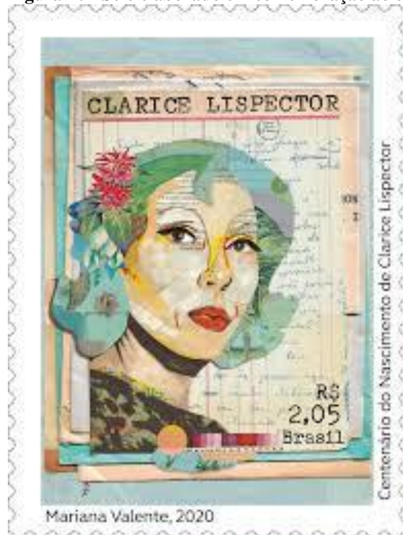
Figura 10 - Selo elaborado em comemoração ao centenário da escritora