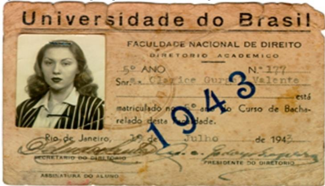
Figura 3 - Carteira de registro profissional de Clarice Lispector