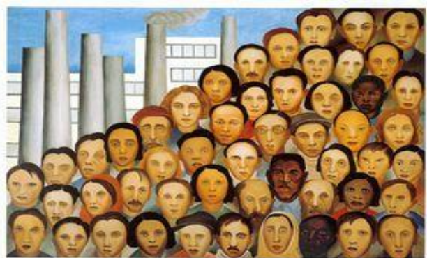
Figura 6 - Quadro Os Operários