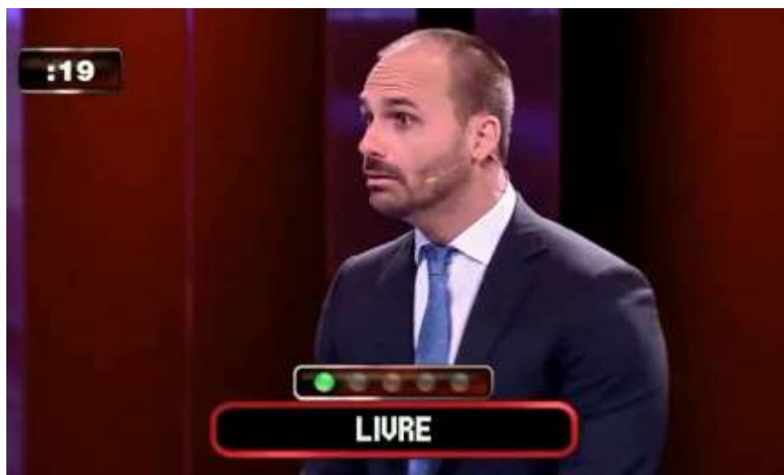
Figura 6 – Eduardo Bolsonaro no programa Mega Senha, após ocorrer a falha.