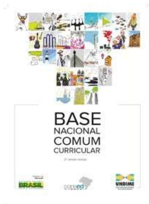
Figura 3 – Capa da 2ª versão da BNCC