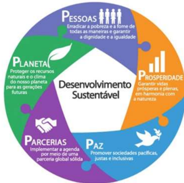
Figura 7 – A Agenda 2030 voltada para o desenvolvimento sustentável