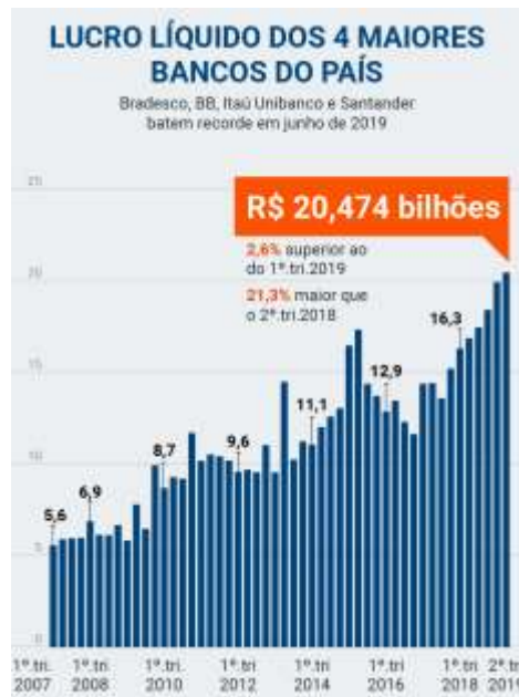
Gráfico 1 – Lucro líquido dos 4 maiores bancos do país