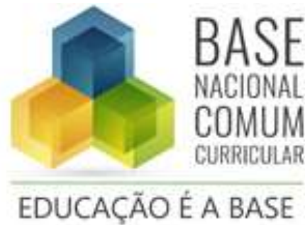
Figura 5 – Versão atual da imagem que representa a BNCC