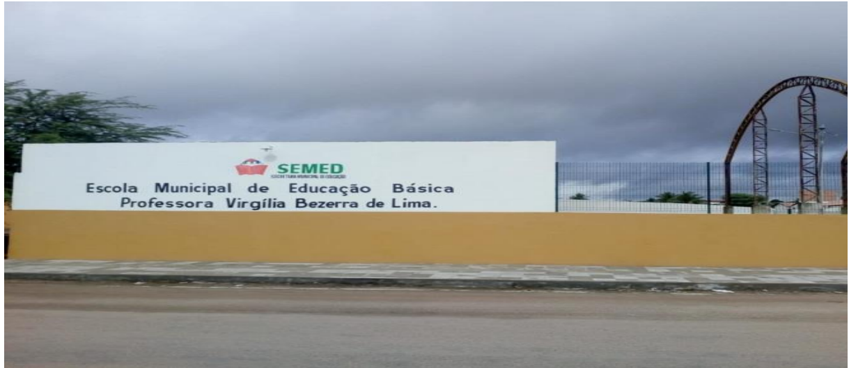
Fotografia 2 – Frente da escola