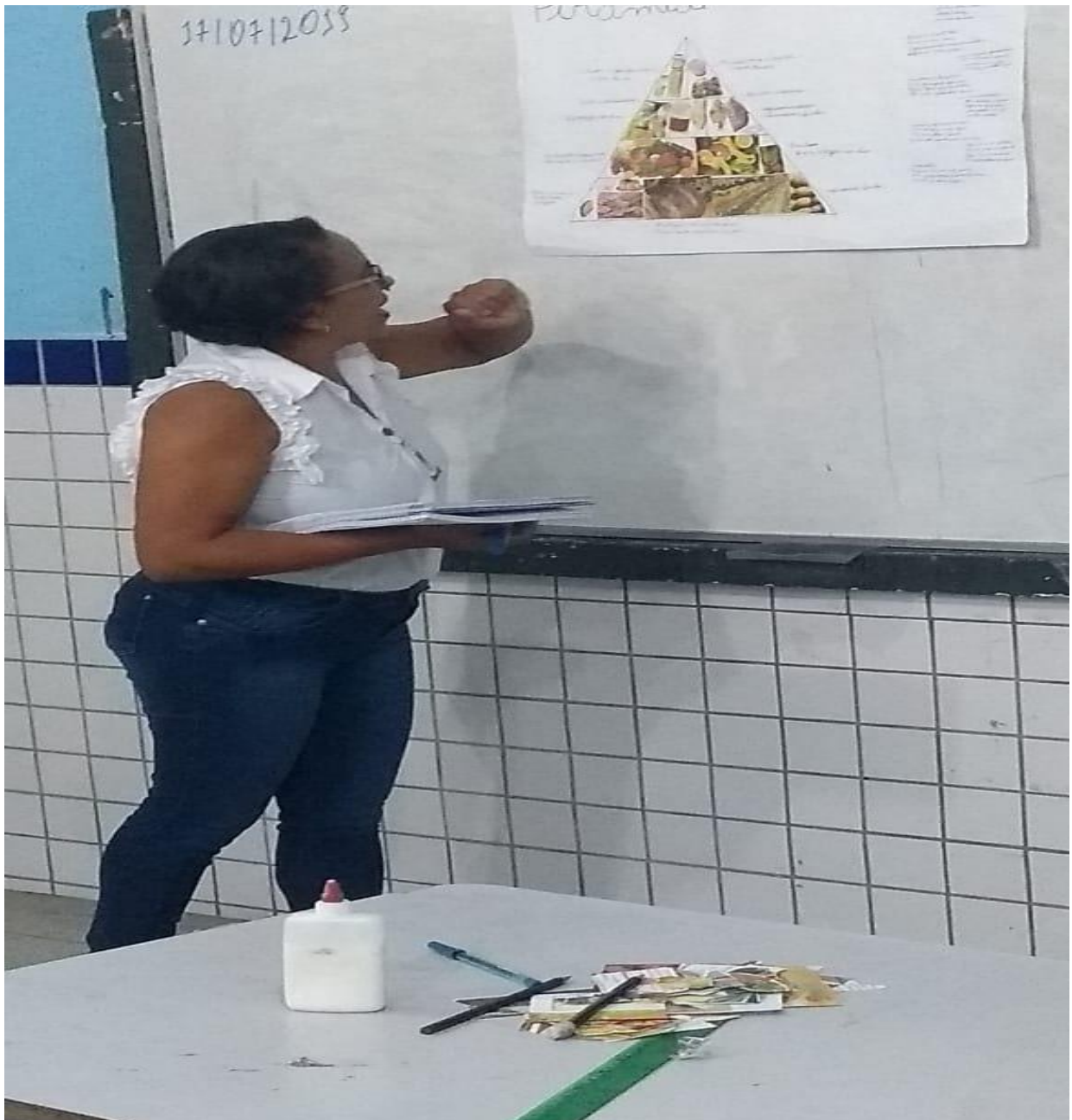
Fotografia 4 - Pirâmide alimentar