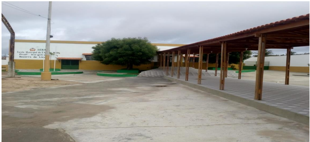
Fotografia 1 – Área interna da escola

A área interna da Escola Municipal de Educação Básica Professora Virgília Bezerra de Lima, ampla para o estudante ficar à vontade em momentos de descontração e contato com os demais alunos da instituição educacional na cidade de Delmiro Gouveia-AL.