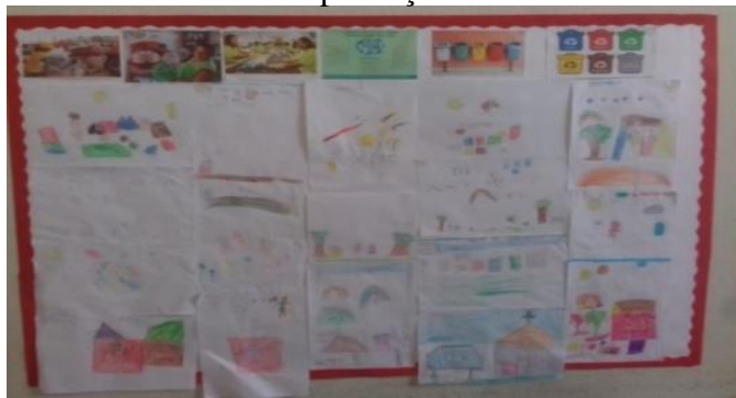
FIGURA 3 – Mural de produções dos desenhos

diagnosticamos os conhecimentos que elas já possuíam sobre a temática trabalhada em sala de aula.