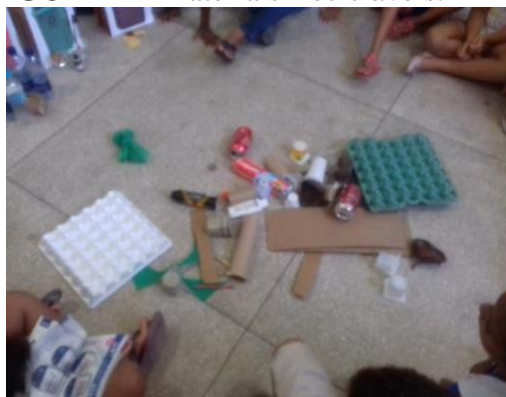
FIGURA 4 - Materiais Recicláveis.

Apresentamos diversos tipos de materiais como lixos e resíduos físicos (material lúdico), solicitando que elas separassem cada um de acordo o seu destino, em cada tipo de lixeira. Nesse momento, inserimos a contagem dos materiais utilizando a Matemática, a conservação do ambiente abordando também o tempo que esses materiais se decompõem na natureza, incluindo dessa forma discussões e problematizações acerca das Ciências naturais.