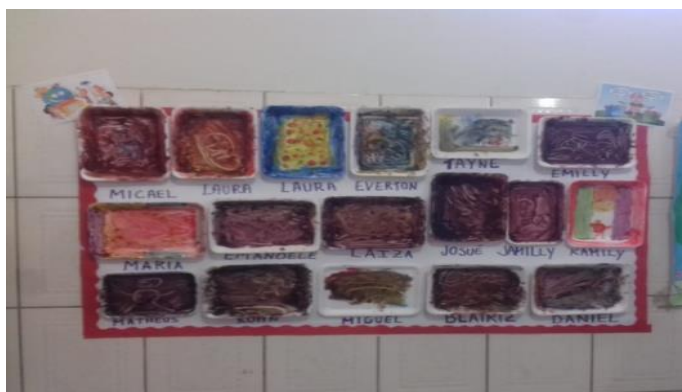
FIGURA 6 - Mural confeccionado.