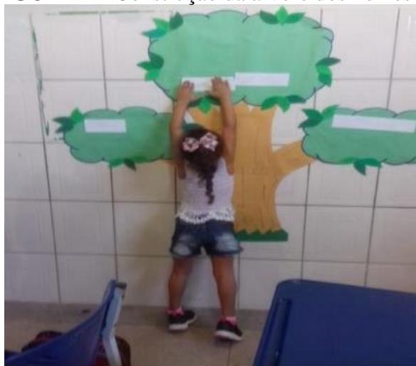
FIGURA 2 - Construção da árvore dos nomes

Distribuímos a nova paródia impressa para turma e auxiliamos na colagem em seus cadernos. Em seguida propomos uma construção da árvore dos nomes, para analisarmos quais noções de escrita eles possuíam, nas atividades práticas da sala de aula.