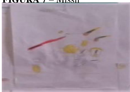
FIGURA 7 – Míssil

Um bom exemplo da interação foi o relato de um aluno sobre o desenho que tinha feito dizendo “imagina um míssil indo para o espaço destruir um meteoro ou algo ameaçador, os lixos podem cair na terra e acabar com o ambiente todo, por que no céu tem muito lixo também”.