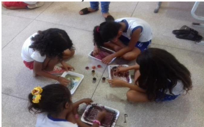
FIGURA 5 - Confeção com material reciclável.

Após realização da atividade, confeccionamos com eles um mural para exposição das obras de artes. Concordamos com Gianotti (2008) quando cita “Ao dar forma a criança se forma”.