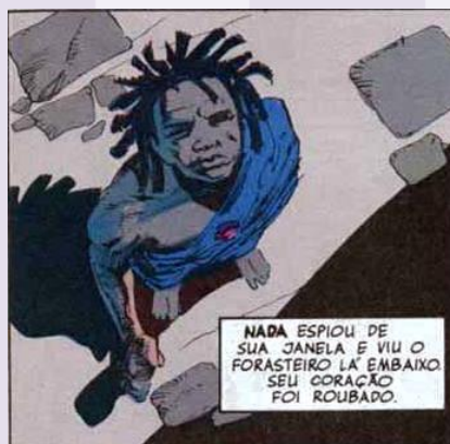
Figura 2: fragmento de Sandman . Fonte: Gaiman, 1989, p. 7.