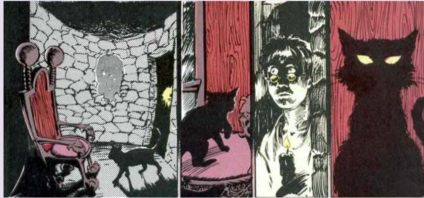
Figura 4: fragmento de Sandman .