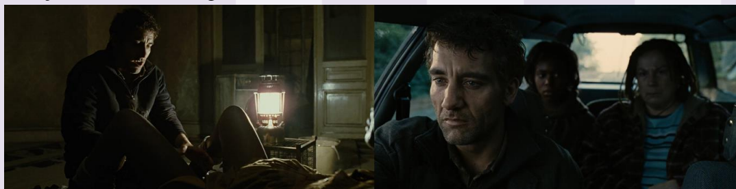
Figura 1 Cenas 1:14:56 e 59 :54

Há cenas em que esse enquadramento e iluminação ficam mais evidentes e, por isso, sustentam essa afirmação, a exemplo da cena do carro após a morte de Jasper, em que a empatia da/o espectadora/or volta-se para Theo e sua dor, enquanto Kee e Miriam ficam em segundo plano, desfocadas; ou a cena do parto, em que a câmera foca apenas em Theo, possuindo uma iluminação em seu rosto, ignorando a mulher dando à luz.