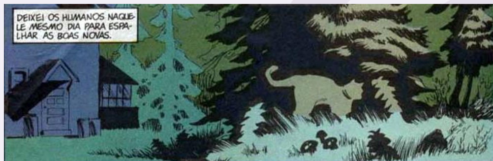
Figura 6: fragmento de Sandman. Fonte: Gaiman, 1990, p. 21.

Surgindo em cima da estátua de um anjo, a gata revela seu papel de salvadora de sua espécie. Esse pensamento torna-se ainda mais forte se levado em conta o fato de que o encontro acontece em um cemitério, simbolizando o declínio do domínio que os gatos um dia já tiveram e que agora está morto. Esse traço de discurso messiânico/profético mostra-se ainda mais forte quando a gata se refere às suas palavras como as “boas novas”, termo de cunho bastante religioso. Esse trecho é mostrado na figura 6.