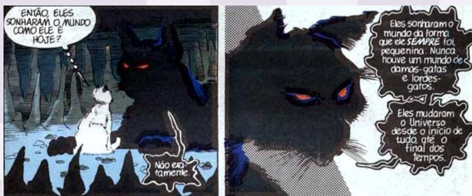
Figura 3: fragmento de Sandman.

Dentro da caverna, depois de convencer os guardiões a deixá-la entrar, a gata finalmente encontra o Gato dos Sonhos. Como já mencionado, Sonho pode assumir diversas formas. Na verdade, sua caracterização depende daqueles(as) a quem ele se apresenta. No caso de Um sonho de mil gatos (1990), por se tratar de uma história sobre felinos, é na forma de um gato que o Rei dos Sonhos se apresenta, como mostrado na Figura 3.