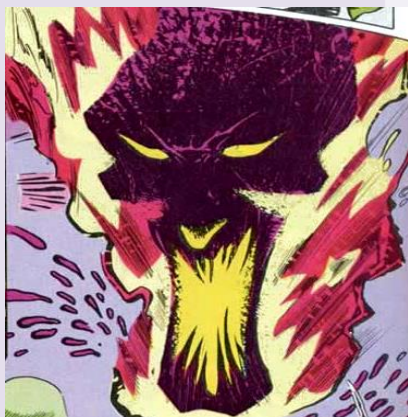
Figura 4: fragmento de Sandman .

Por vezes, as distintas denominações correspondem a diferentes aparências. Isso pode ser comprovado através dos exemplos das Figuras 1 e 2 listadas abaixo, nas quais Sandman assume as formas de uma entidade venerada pelos marcianos e um forasteiro descrito num conto sobre a destruição de uma próspera cidade de vidro, respectivamente.