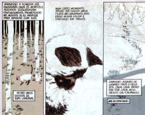
Figura 7: fragmento de Sandman. Fonte: Gaiman, 1990, p. 12.