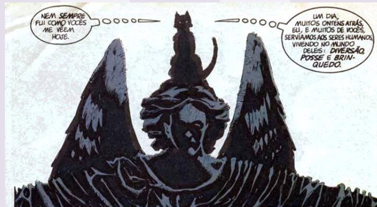
Figura 5: fragmento de Sandman. Fonte: Gaiman, 1990, p. 7.

Surgindo em cima da estátua de um anjo, a gata revela seu papel de salvadora de sua espécie. Esse pensamento torna-se ainda mais forte se levado em conta o fato de que o encontro acontece em um cemitério, simbolizando o declínio do domínio que os gatos um dia já tiveram e que agora está morto. Esse traço de discurso messiânico/profético mostra-se ainda mais forte quando a gata se refere às suas palavras como as “boas novas”, termo de cunho bastante religioso. Esse trecho é mostrado na figura 6.