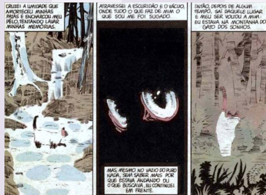
Figura 8: fragmento de Sandman. Fonte: Gaiman, 1990, p. 12.

Para a descrição da jornada da gata, é usado um amontoamento de quadrinhos estreitos com tamanhos quase iguais. Esse recurso, nas palavras de Eisner (1989), serve para conferir o aceleração do ritmo da leitura, desenvolvendo uma narração ininterrupta. De acordo com o autor, “Nas modernas tiras ou revistas de quadrinhos, o recurso fundamental para a transmissão do timing é o quadrinho” (EISNER, 1989, p. 28). Timing , por sua vez, é descrito por Eisner como “o uso dos elementos do tempo para a obtenção de uma mensagem ou emoção específica” (EISNER, 1989, p. 26), elementos esses que incluem, além de outros meios, o quadrinho e o balão. O timing , então, a partir dos quadros mencionados, indica a dificuldade da busca da gata.