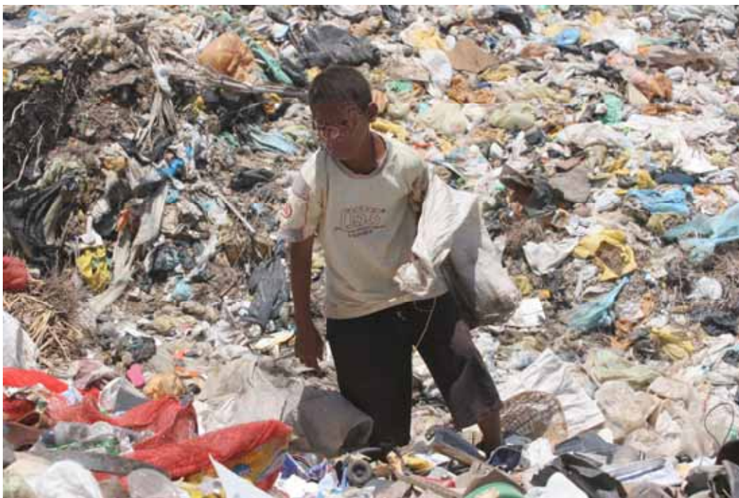
FAMÍLIAS BENEFICIÁRIAS DO PETI – MACEIÓ, NA CATAÇÃO DO LIXO