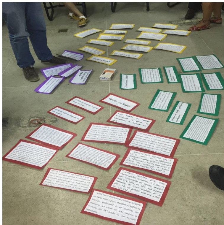
Figura 2. Disposição das tarjetas apresentando os resultados da pesquisa, no centro da roda de conversa.