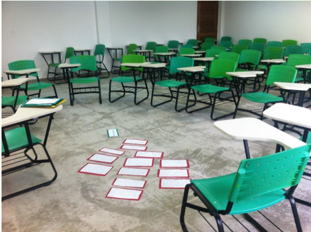
Figura 1. Organização da Roda de Conversa.