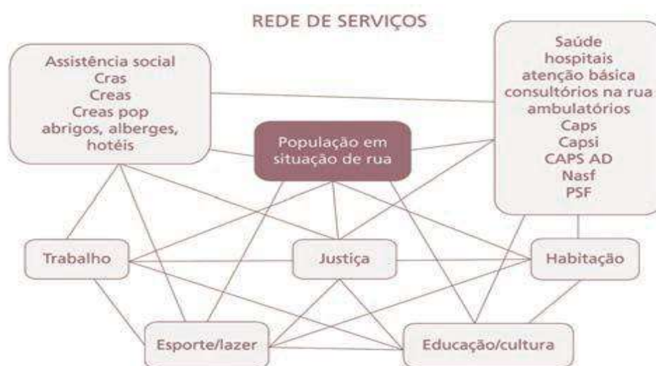
Figura 3 - Rede de Serviços para a População em Situação de Rua.

Sampaio (2015, p. 59) nos dá um exemplo de rede formal de serviços para a população em situação de rua que, como podemos verificar, inclui diversos setores, dada a amplitude de necessidades desta população (Figura 1, abaixo).