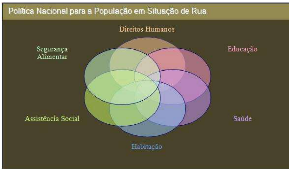
Figura 2 - Intersetorialidade da Política Nacional para População em Situação de Rua.