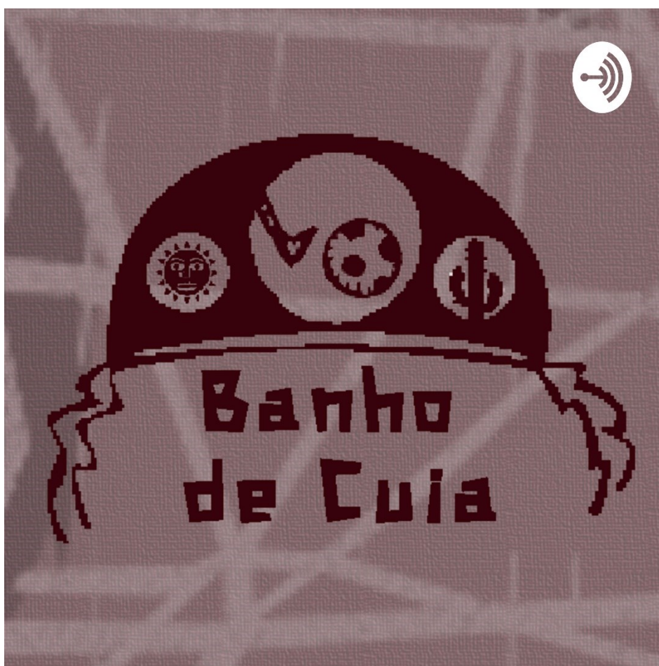
FIGURA 1 – Logo do programa de podcast Banho de Cuia .

A logo possui um fundo com as cores em tons de marrom, simbolizando a cor usada por cangaceiros, que fazem parte da cultura e da história nordestina. O elemento principal é um chapéu de cangaceiro customizado. Ao invés das estrelas, a decoração do chapéu traz elementos como cacto, sol e, ao centro, uma perna dando um chute em uma bola. Abaixo do chapéu, o nome Banho de Cuia , centralizado em destaque, com a mesma cor do chapéu, escrito na fonte Xilosa, que é bastante usada em impressões de literatura de cordel (FIGURA 1).