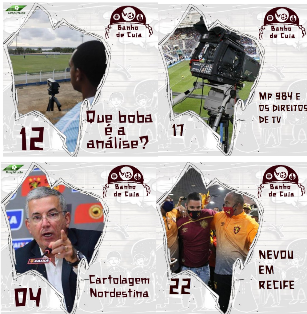
FIGURA 2 – Exemplos de capas de episódios do Banho de Cuia .

em fonte Xilosa. centralizada, o fundo transparente para inserir uma imagem referente ao tema do programa.