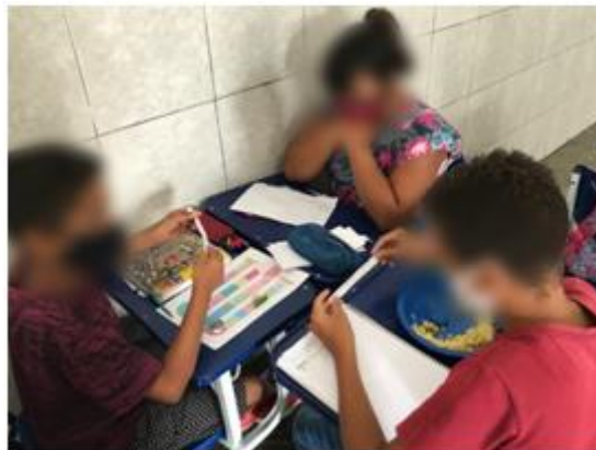
Figura 5 - Crianças brincando com circuito "O que penso sobre o bullying!"