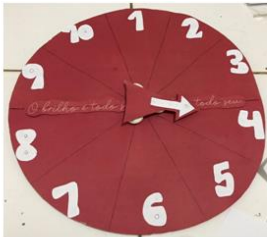
Figura 1 - Roleta Numérica

A roleta possuía números de um a dez, em cada número existia uma questão matemática, para que os alunos pudessem responder com a ajuda dos estagiários.