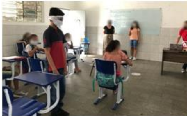
Figura 3 - Criança brincando da dinâmica Cobra - cega

A dinâmica consistiu em uma atividade de cooperação e trabalho em equipe, em que dois alunos foram selecionados para a realização da mesma. A dinâmica possuía dois personagens, um “cego” e um “guia”, sendo posicionado em pontos diferentes da sala.