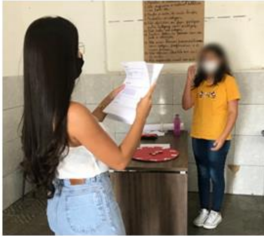
Figura 2 - Criança brincando com Roleta Numérica