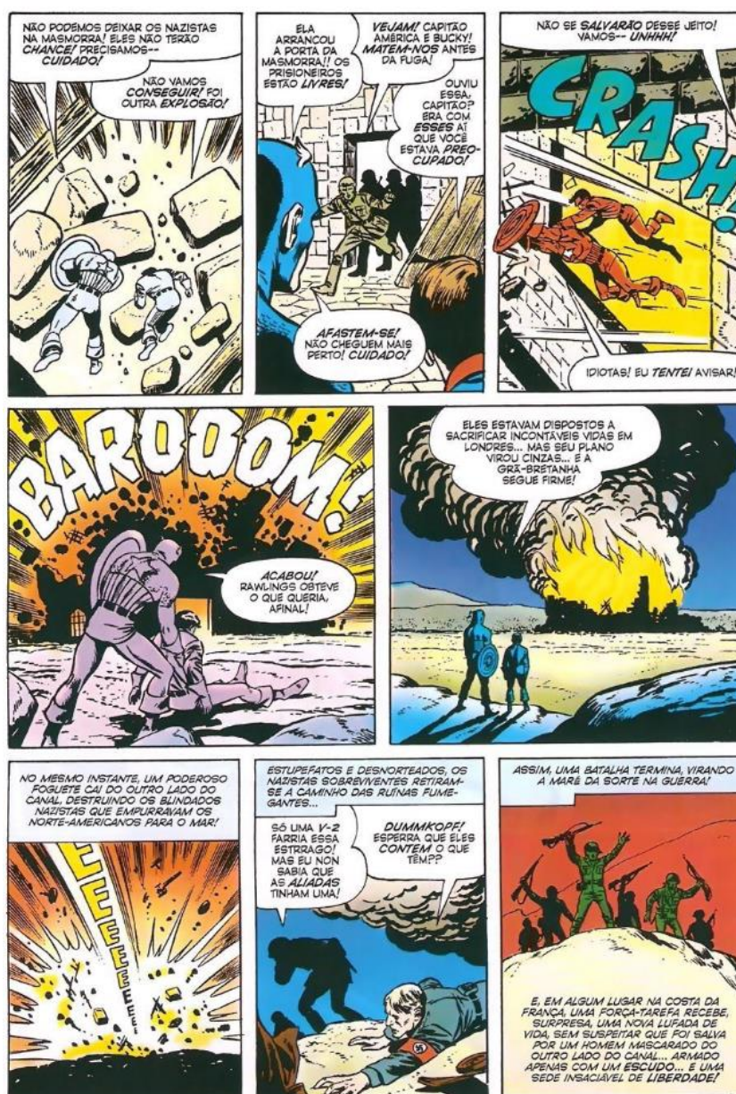
Figura 8 - Capitão América impede a invasão Alemã e o ataque em Londres.

Fonte: Capitão América V1 (1968), p. 41.