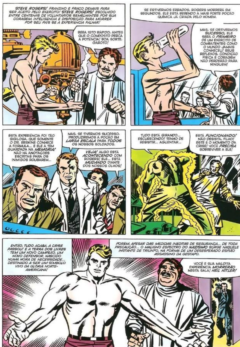
Figura 2 – Surge um herói, o Capitão América.