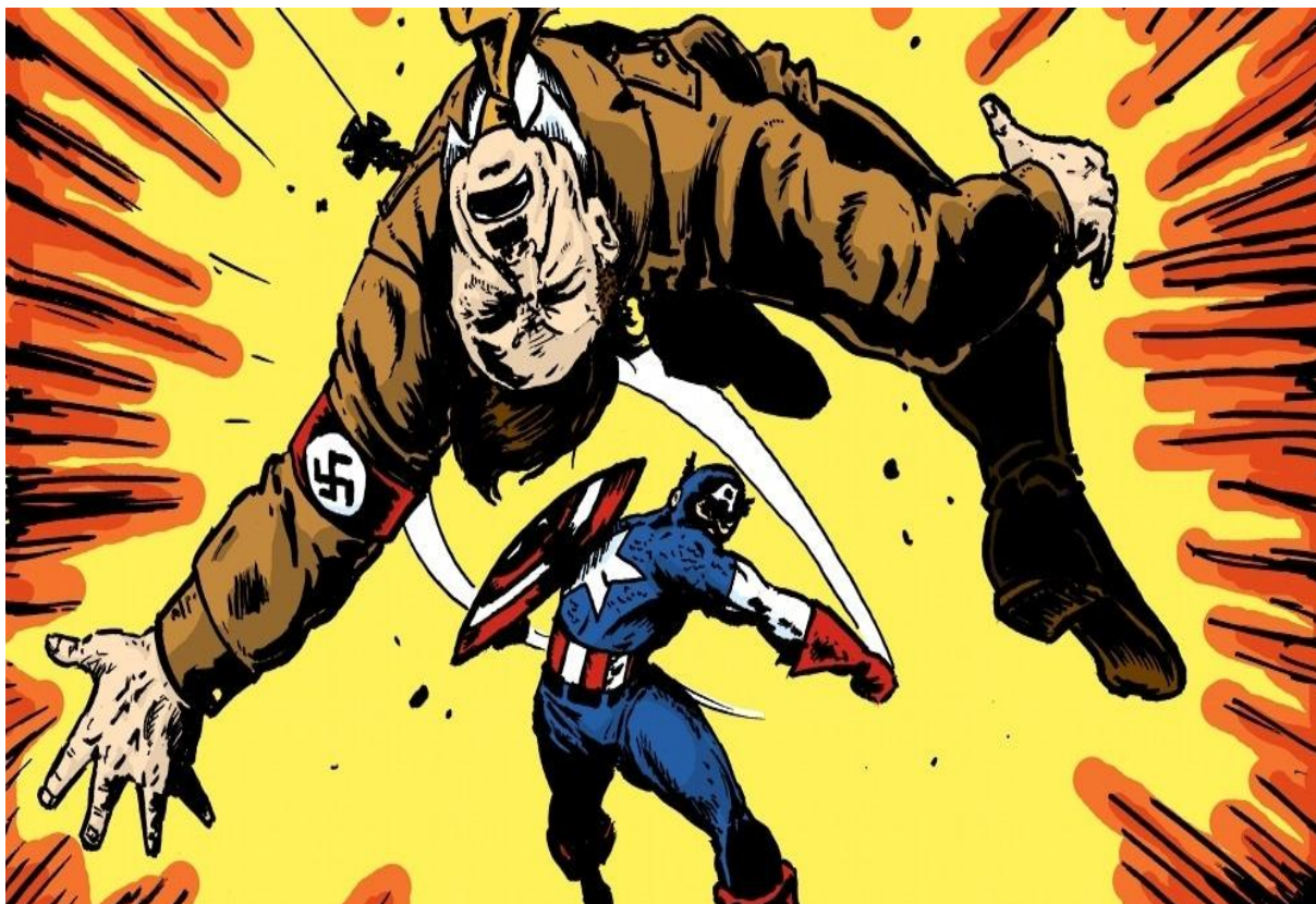
Figura 5 – Capitão América derrotando Hitler.