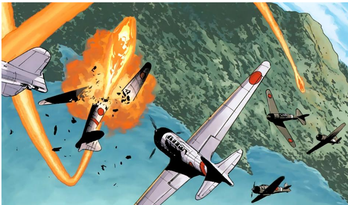
Figura 3 - Ataque de Pearl Harbor.