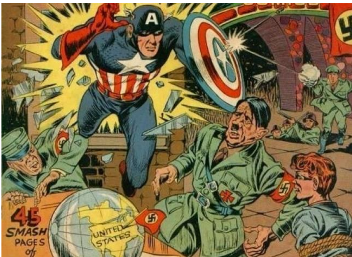
Figura 9 - Capitão América impedindo o plano de ataque aos EUA.