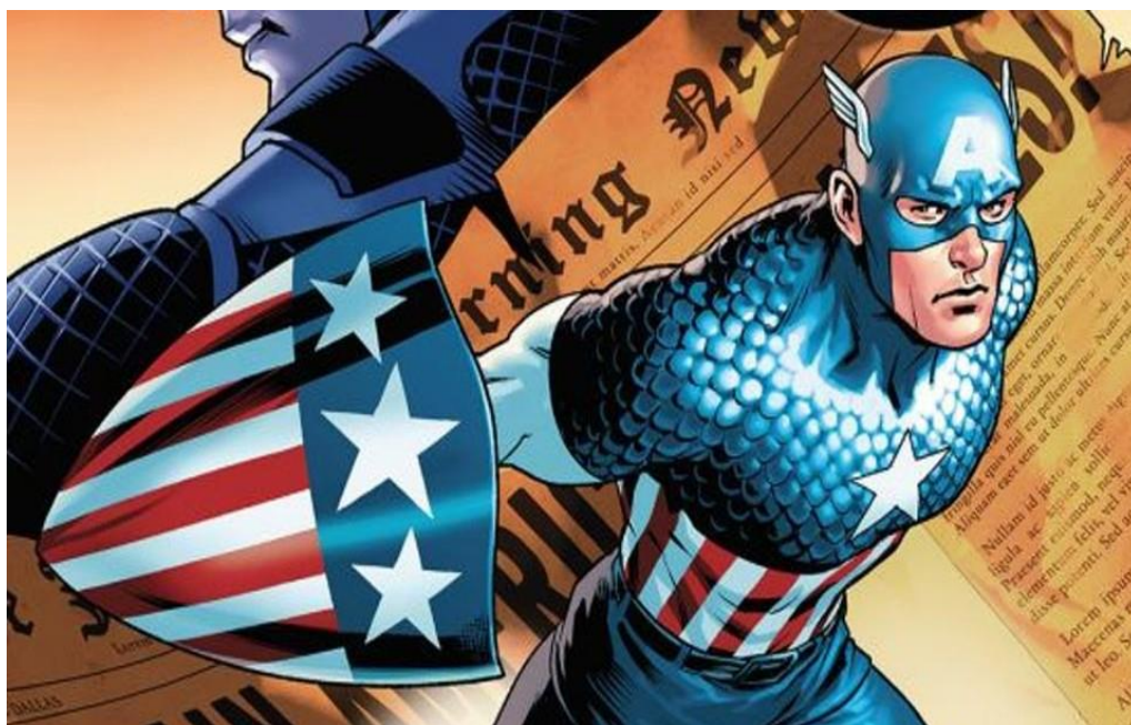
Figura 1 - Capitão América.

Os quadrinhos do Capitão América representam um momento especial da história do século XX, período que vendeu quase um milhão de exemplares e ao longo da segunda guerra se tornando o personagem mais popular da época. Os quadrinhos fizeram tanto sucesso que em 1944 a produtora de filmes Republic 2 criou um seriado em preto-e-branco, produção que se tornou a primeira de um super-herói da Marvel ao cinema. O Capitão América passou de um personagem criado como um herói no sentido mais estrito, como perspectiva de entretenimento que, com o passar do tempo, migrou de um tipo de gênero imagético-textual (revista em quadrinhos) a um tipo de mídia audiovisual (televisiva e cinematográfica) que pode ser transmitido, em sala de aula, associado a alguns conteúdos de história, tornando esse tipo de gênero mais criativo e motivador para os alunos (VERGUEIRO e RAMOS, 2009).