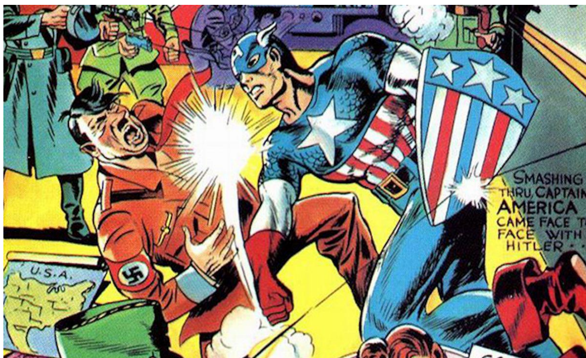
Figura 4 - Soco em Hitler representando a luta contra o Nazismo.